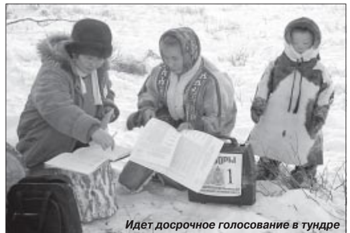
Идет досрочное голосование в тундре

- По центральным телевизионным каналам видел репортажи, в которых председатель Центральной избирательной комиссии РФ Владимир Чуров рассказывал о