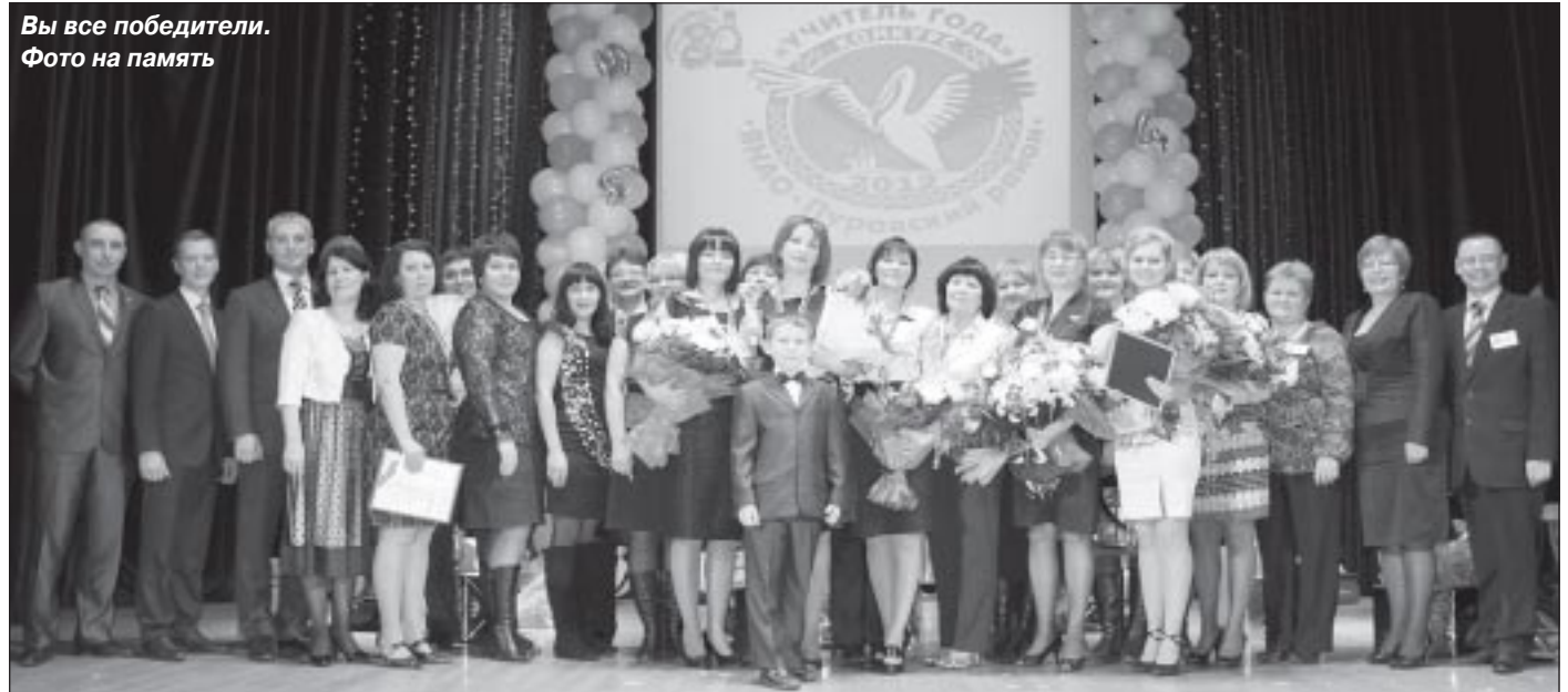
Вы все победители. Фото на память

Надеемся на дальнейшее плодотворное сотрудничество!