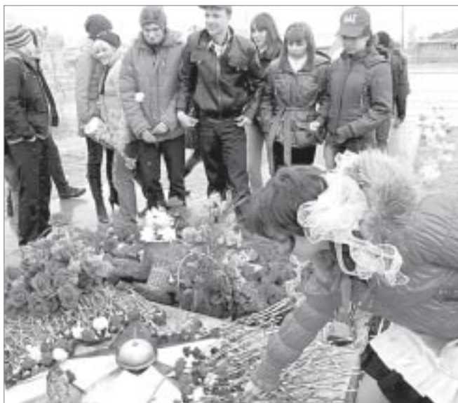
▲ Возложение цветов к Вечному огню в Пурпе

Ну а остальную часть вечера молодежь уже радовали приглашенные артисты из творческой лаборатории DNK г.Екатеринбурга. ■