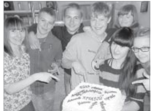
▲ Праздничный торт уренгойских пионеров

Акция «Салют, пионерия!» прошла в Ханымее. В рамках этой акции состоялся торжественный сбор «Мы – будущее России», во время которого прошли игра «Пионерская маевка» и встреча