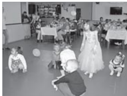
▲ На празднике в кафе

Взрослых тоже не оставили в стороне, им предоставили возможность поучаствовать в кон-