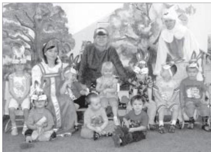
▲ Костюмированное развлечение

Питаются дети здесь же. Еду для них готовят повара школы в соответствии с меню, разработанным и составленным с учетом возрастных норм и требований. Ребятам, наигравшись и набегавшись, с аппетитом съедает питательные и вкусные завтраки, обеды и ужины.