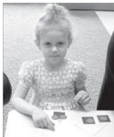
▲ Я выкладываю дом