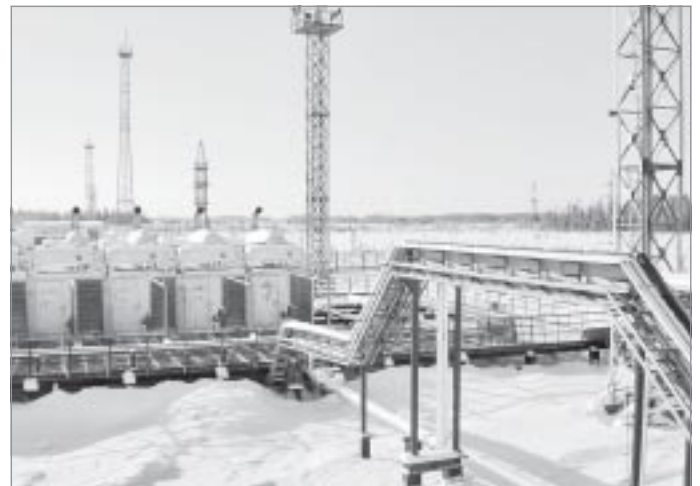
На одном из производственных объектов ООО «НоваЭнерго»

На сегодняшний день ООО «НоваЭнерго» располагает современной приборной базой для проведения испытаний, измерений, наладки, эксплуатации и ремонта электро- и теплотехнического оборудования.