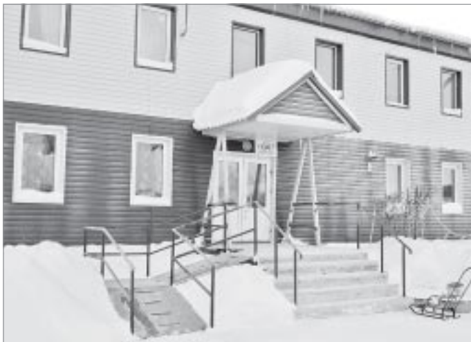
Обновленное после капитального ремонта здание уренгойского отделения дневного пребывания