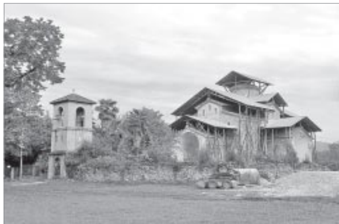
Лыхненский храм построен более тысячи лет назад