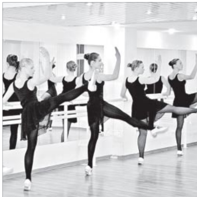
Упорные тренировки - залог успеха

года, «Сударушка» привезла не только Гран-при, но и приглашения от представителей посольств Египта и Англии на дни русской культуры - настолько профессионально сработали и воспитанники, и педагоги, ведь такие достижения невозможны без поддержки талантливых учителей, профессионалов своего дела, отдающих детям все свои знания, вкладывающих душу в любимое ремесло.