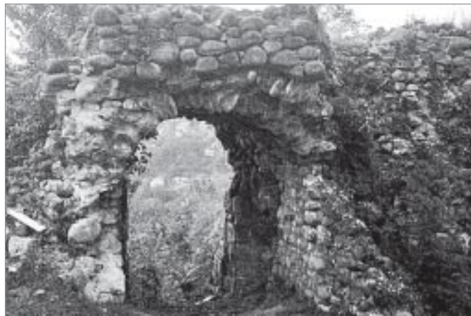
Руины крепости царя Баграта III

Вблизи Сухума минуем узкий мостик через горную речку. Внизу глубокое ущелье, поэтому мост имеет стратегическое значение. Во время войны 1992-1993 годов здесь проходили очень жаркие бои. Напоминание об этом - портреты защитников, в несколько рядов развешенные на тянущейся вдоль дороги скале. Мимо окон машины пролетают изображения лиц молодых парней и зрелых мужчин, и на душе стано-