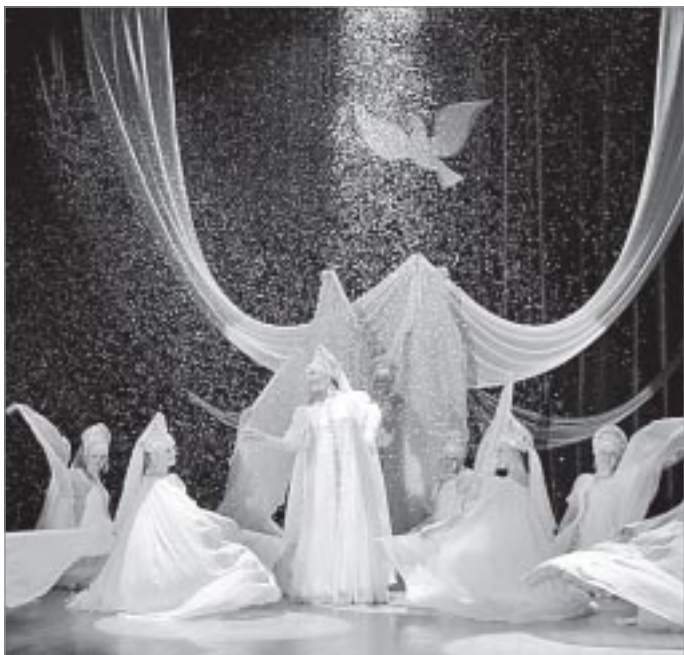
«Северный хоровод» - визитная карточка ансамбля

Авторы: Мария ШРЕЙДЕР, Екатерина ГУСМАНОВА