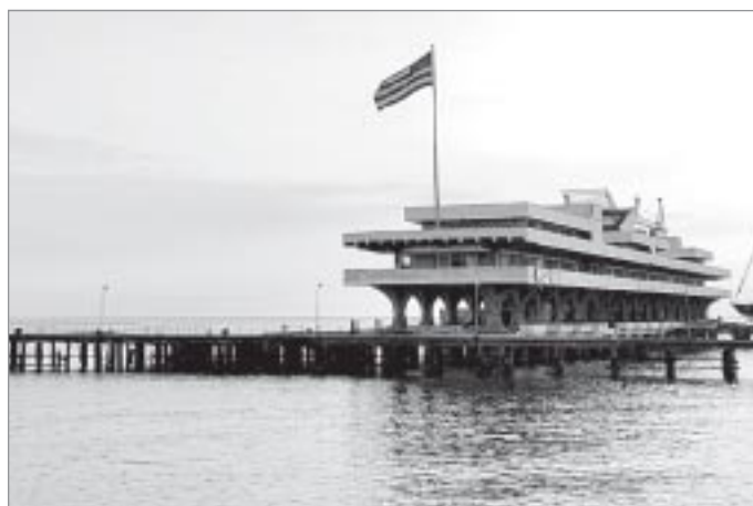
Морской вокзал Сухума построен в виде лайнера