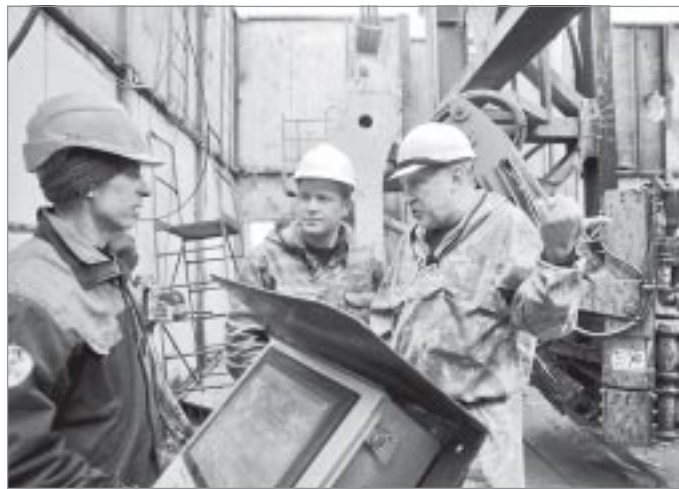
Обсуждение производственных вопросов