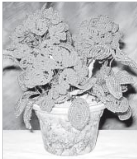
Деревья из бисера - это целые художественные композиции

А сколько у нее еще новых планов, задумок, идей! Поистине нет предела совершенству!