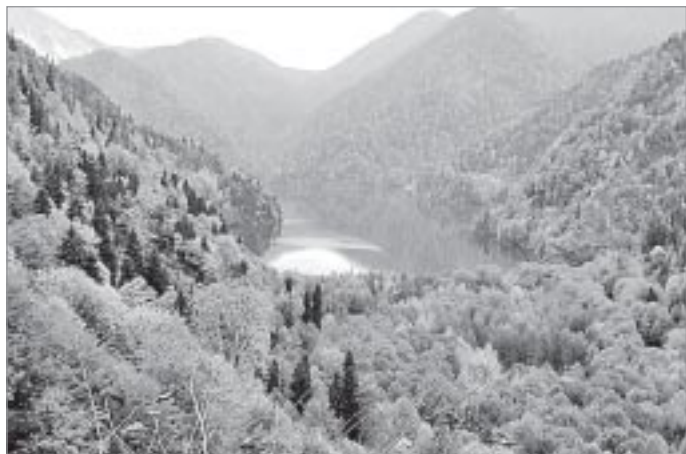
Озеро Рица - еще один символ Абхазии

На озере Рица мы устраиваем привал. В планах - попасть на дачу Сталина, расположенную