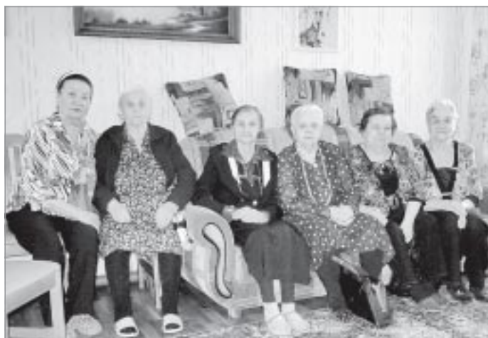
Главные подопечные отделения - пожилые люди

Для нее и руководимого ею коллектива специалистов, а главное - для пожилых людей и инвалидов, пользующихся услугами филиала, минувший год завершился с большим знаком плюс. Можно предположить, что не менее удачно для них будет складываться и наступивший год, в который они вошли с новыми надеждами и планами. ■