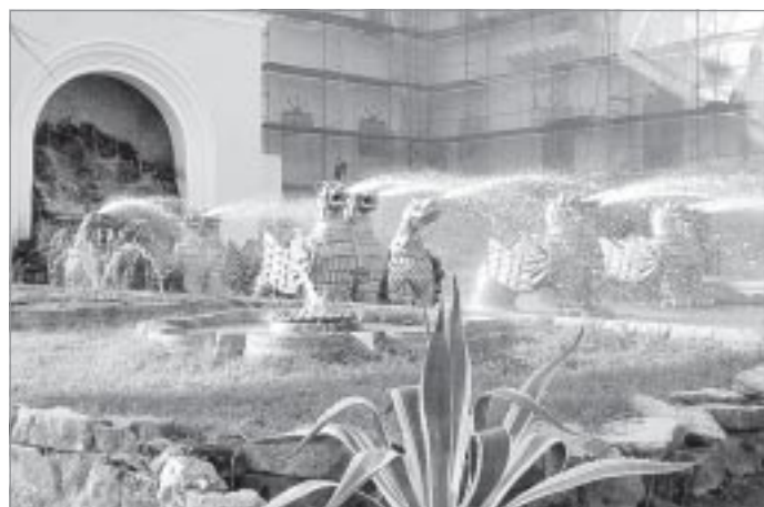
Набережную столицы украшает прекрасный фонтан

Через пару дней, когда мы покидаем Абхазию, я уже думаю о своей следующей поездке сюда. Воображение рисует картины мест, в которых я не успел побывать или тех, где хотел бы оказаться еще раз. До новой встречи, страна моей души! ■