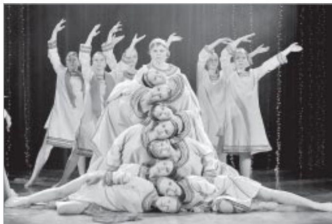
«Сохрани, земля!» - танец русской души

Из последней поездки на Международный фестиваль-конкурс «Рождественские звезды», проходивший в Москве в январе 2013