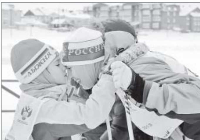
Поддержка близких - самая настоящая награда

Торжественное открытие началось с марша участников лыжных соревнований. Все они, от мала до велика, бодрым шагом, с горящими глазами и готовностью в любую секунду броситься наперегонки