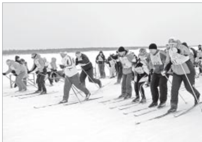
На старте - руководители района и города

Любовь к лыжному спорту у жителей Ямала в крови - даже самые маленькие участники спортивного праздника были готовы целиком и полностью покорить всю дистанцию пуровской лыжни, демонстрируя настоящую силу духа и недюжинную волю к победе. Малыши трех-четырёх лет гордо шли на старт, а участники постарше подзадоривали друг друга перед началом гонки и утешали на