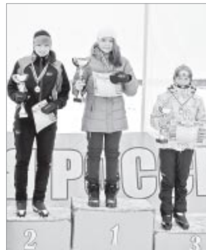
Призеры «Лыжни России» на дистанции 2 километра

И действительно, все участники «Лыжни России-2013» получили памятные сувениры и, самое главное, показали пример не только подрастающему поколению, но и взрослым. Соревнования подарили всем настоящий заряд бодрости и отличного настроения! Молодцы, ямальцы!