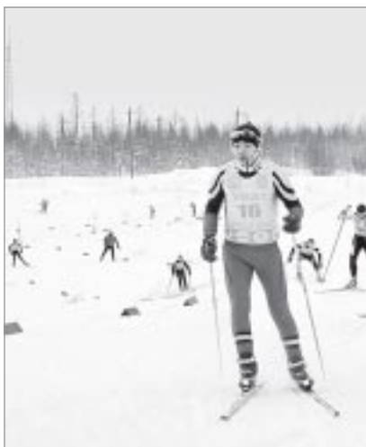
На дистанции 2 километра - спортсмены со всего Ямала

В МИНУВШЕЕ ВОСКРЕСЕНЬЕ, 17 ФЕВРАЛЯ НА ЛЫЖНОЙ ТРАССЕ В РАЙОНЕ ГОРОДСКОГО ПЛЯЖА ТАРКО-САЛЕ ДАЛИ СТАРТ САМОЙ МАССОВОЙ ЛЫЖНОЙ ГОНКЕ СТРАНЫ «ЛЫЖНЯ РОССИИ-2013». РЕГИСТРАЦИЯ УЧАСТНИКОВ НАЧАЛАСЬ В 10 ЧАСОВ УТРА, НО И К 12 - НАЧАЛУ СОРЕВНОВАНИЙ - ВСЕ ЕЩЕ НЕ БЫЛО ОТБОЯ ОТ ЖЕЛАЮЩИХ ИСПЫТАТЬ СВОИ СИЛЫ НА ЯМАЛЬСКОЙ ЛЫЖНЕ. ОРГАНИЗАТОРЫ СПОРТИВНОГО ПРАЗДНИКА - АДМИНИСТРАЦИЯ ТАРКО-САЛЕ, КУЛЬТУРНО-СПОРТИВНЫЙ КОМПЛЕКС «ГЕОЛОГ» И ПУРОВСКАЯ СПЕЦИАЛИЗИРОВАННАЯ ДЕТСКО-ЮНОШЕСКАЯ СПОРТИВНАЯ ШКОЛА ОЛИМПИЙСКОГО РЕЗЕРВА СОЗДАЛИ ВСЕ УСЛОВИЯ ДЛЯ КОМФОРТНОГО ПРОВЕДЕНИЯ МЕРОПРИЯТИЯ.