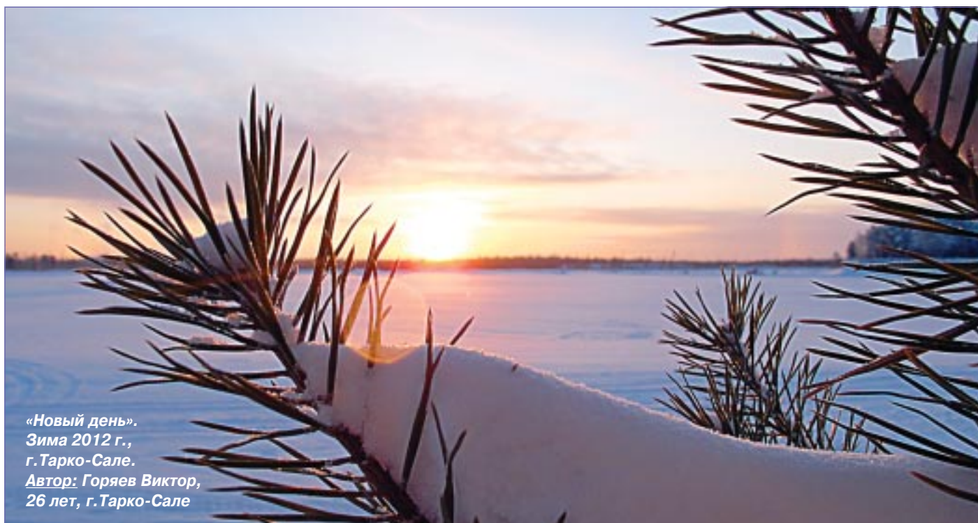
«Новый день». Зима 2012 г., г.Тарко-Сале.