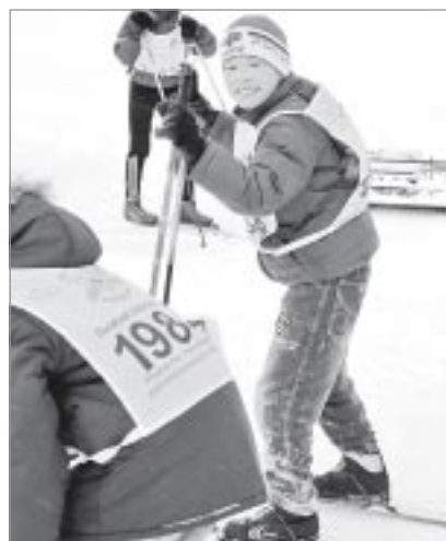
Юным пуровчанам любая трасса по плечу!

В программе мероприятия были заявлены четыре дистанции: детская на 500 метров, две массовые по два километра каждая, а также забег на 500 метров для руководителей Пуровского района и нашего города, руководителей организаций и предприятий Тарко-Сале. Наряду с таркосалинцами в гонке приняли участие спортсмены из Уренгоя и Пурпе, Ноябрьска и Нового Уренгоя.