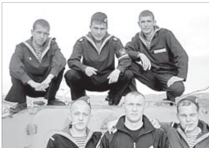
С сослуживцами в Гаджиево, 2006-2008 годы

В новой части все было в новинку. Каждое утро построение и поднятие флага, развод на работы, причем военнослужащие всех категорий, начиная от матросов и заканчивая заместителем командира части,