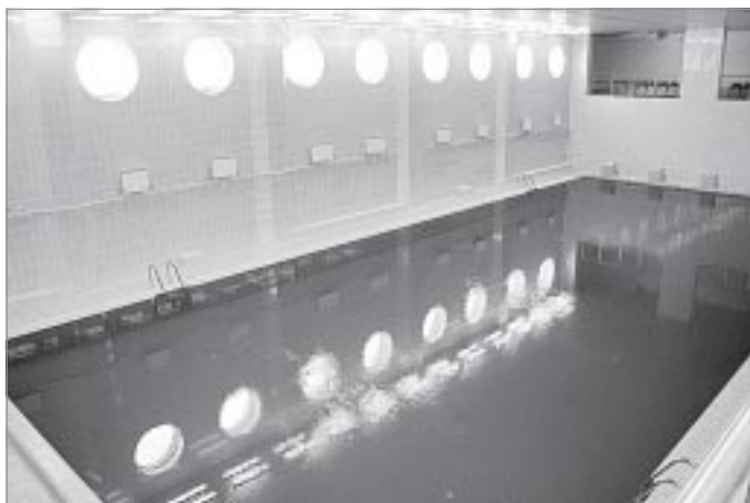
Скоро в спорткомплексе будет готов бассейн

Как отметил Евгений Скрябин, среди основных задач, на выполнение которых будут нацелены органы власти в ближайшее время, - строительство в Ханымее детского сада и больничного комплекса. ■