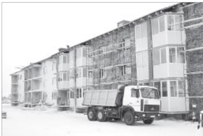
Строящийся 24-квартирный дом