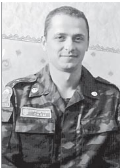
Июль 2008 года. Приграничная зона у южноосетинского города Цхинвал. Российский миротворческий батальон

шей группе поставили задачу: отбить один из захваченных объектов. В принципе, силы противника были подавлены достаточно быстро, хотя готовились нападавшие тщательно. После боя, при осмотре территории и ликвидированных боевиков на предмет обнаружения взрывных устройств, нас поразило, сколько провианта, медикаментов и боеприпасов они несли с собой.