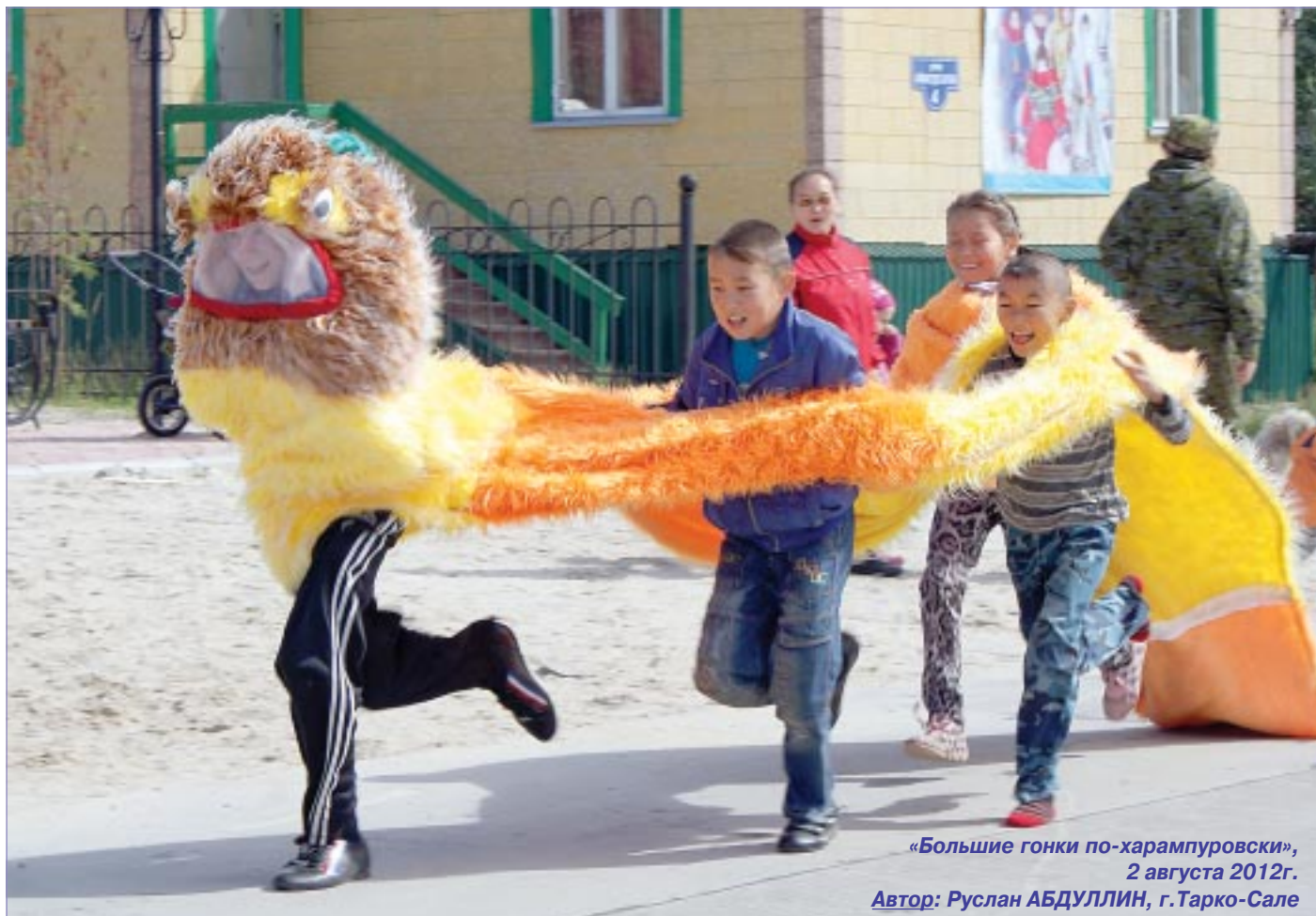
«Большие гонки по-харампуровски», 2 августа 2012г.