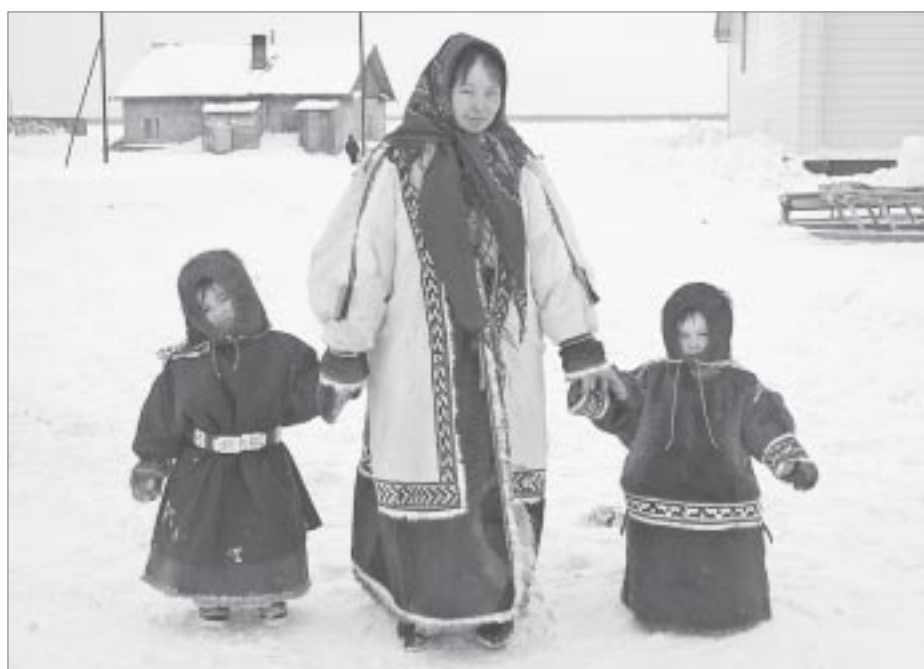
Ненецкие женщины славятся мастерством пошива национальной одежды

Чем многочисленнее семья у оленевода, тем больше требуется женщинам шить одежды для ее членов. Верхней мужской одеждой являются малица и совик. Малица шьется из осенних или летних оленьих шкур мехом внутрь. По покрою она напоминает просторную рубашу, опускающуюся ниже колен. Для пошива малицы необходимы четыре оленьих шкуры. Капю-