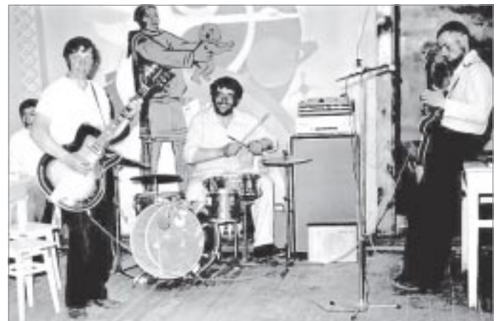
Электрогитары и барабаны - из Москвы и Ленинграда

Сегодня в Самбурге строительство идет повсюду. На стройплощадках трудятся другие люди. Здорово, что в последние год-два в селе возводят дома не только приезжие подрядчики, но и бригады из местных жителей. Я люблюсь на новостройки, но по-прежнему