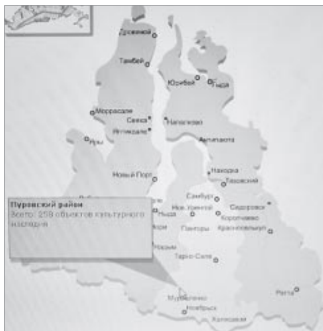
В 2010 году в Пуровском районе было 258 объектов культурного наследия, сейчас их 286

Если говорить о числе памятников археологии, то открыта небольшая их часть,