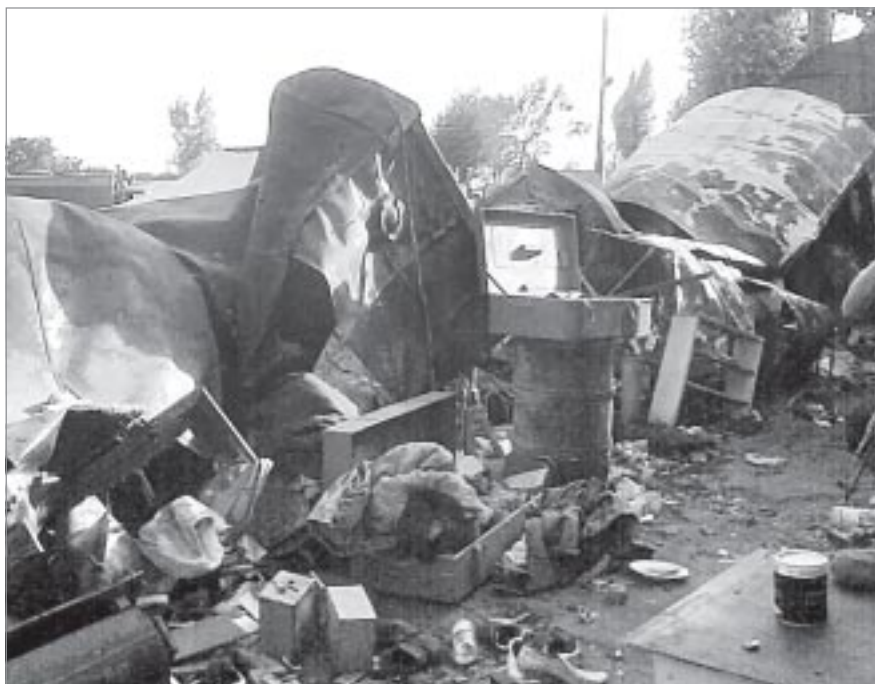
Штаб российского миротворческого батальона. Дизельные установки ЭСД-100ВС400 после бомбежки