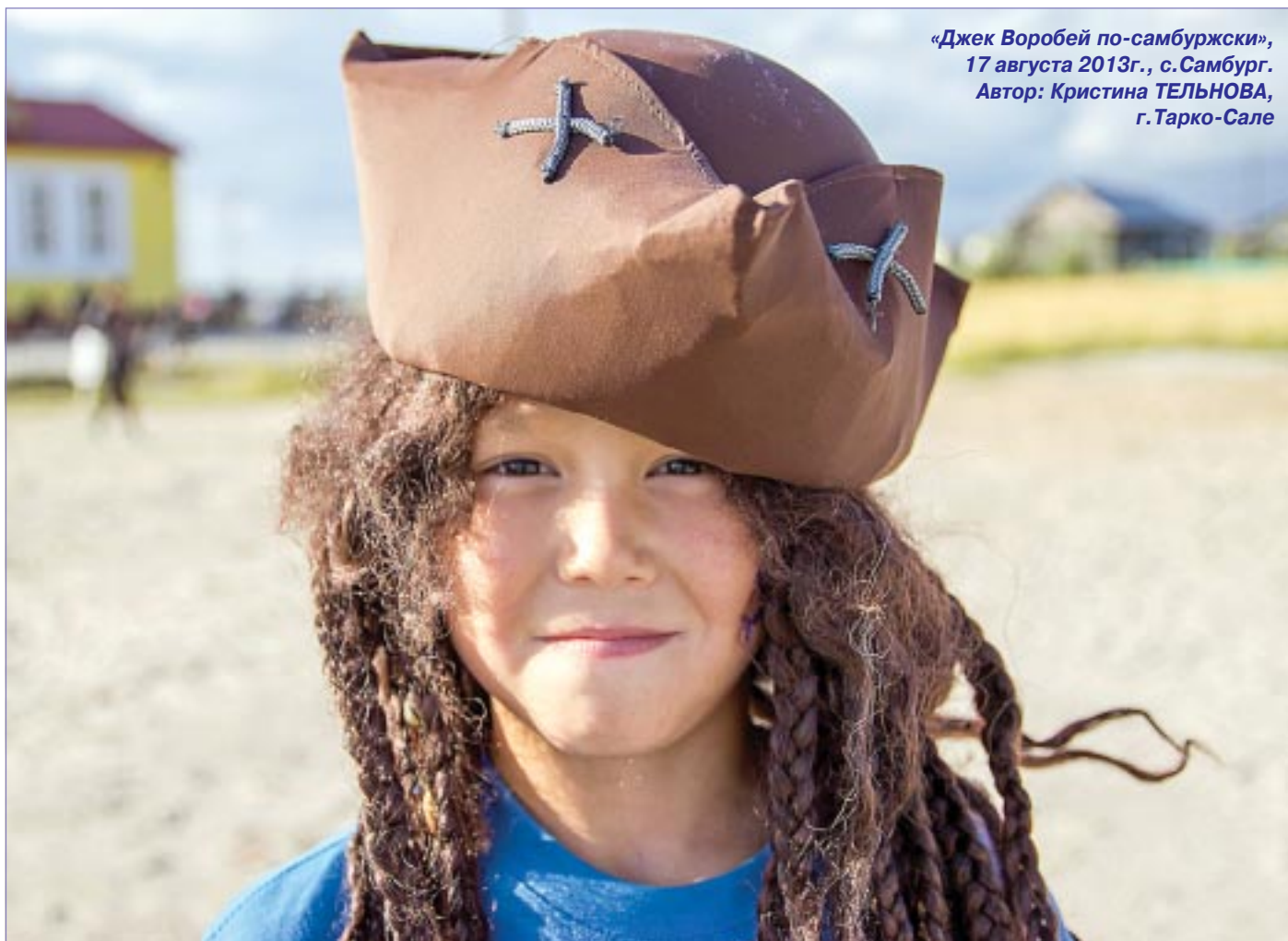
«Джек Воробей по-самбуржски», 17 августа 2013г., с.Самбург. Автор: Кристина ТЕЛЬНОВА, г.Тарко-Сале