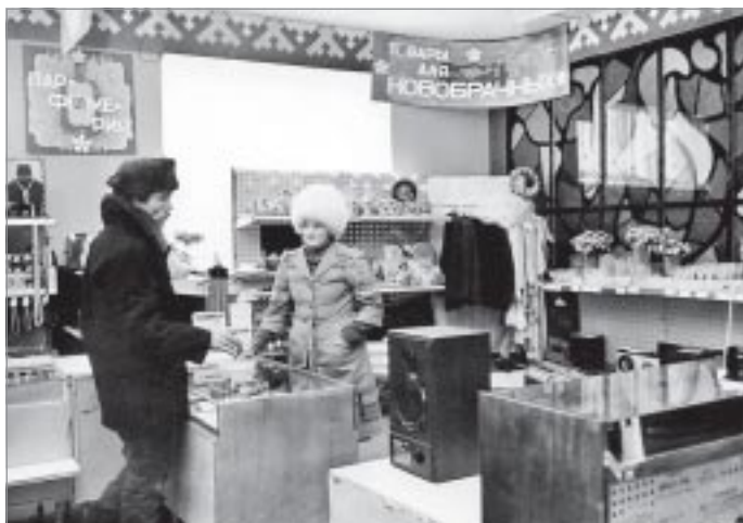
Не хлебом единым...

1953. Одной из вновь образованных улиц Тарко-Сале было присвоено название Рабочая. Впервые на реку Пяку-Пур, напротив райцентра, приземляется гидросамолет «Каталина», обслуживающий 501-503 стройку. Принято решение о консервации строительства железной дороги Салехард - Игарка.