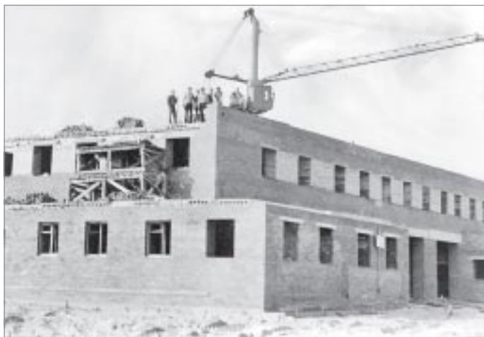
Так начинался город капитальный

1984. Появились улицы Таежная, Тихая, Северная и Водников.