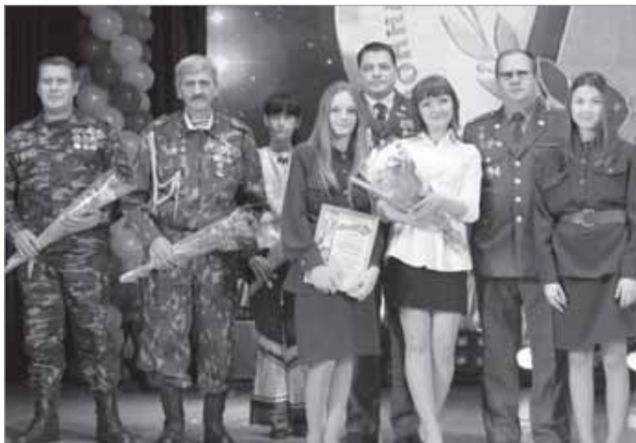
Участники, гости и члены жюри конкурса-фестиваля

Уже с самого раннего утра заснеженный гостеприимный Тарко-Сале встречал иногородних участников фестиваля. Талантливые исполнители песен приехали в наш город со всего Пуровского района. Дальняя дорога и морозная погода февраля не остановили их - любовь к песне, желание поделиться своими талантами со зрителями были сильнее.