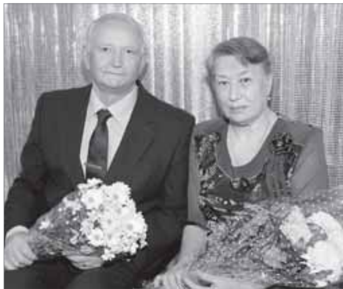
Чета Кремковых отметила изумрудную свадьбу

Исполнено 567 извещений о внесении исправлений и (или) изменений в записи актов гражданского состояния, посту-