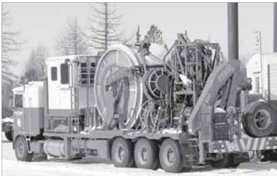
Технический парк предприятия постоянно совершенствуется

Одна из приоритетных задач для компании - модернизация производства и внедрение передовых технологий. Пошел уже четвертый год, как в ЯПС при промыслово-технических исследованиях приступили к использованию установки ГНКТ, имеющей целый ряд очевидных преимуществ перед промыслово-геологическими исследованиями, проводимыми с забойным трактором. «Одно из них - равномерная скорость и качественная запись на спуске в горизонтальной части скважины», - поясняют специалисты. Другим, по