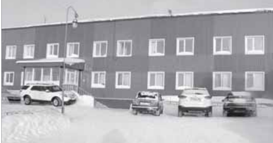
Старое административное здание, в котором расположено ООО «Ямал Петросервис»

И вообще, на предприятии убеждены, что трудности на то и существуют, чтобы их героически преодолевать. Что они с успехом и делают. И сегодня, в преддверии Дня геолога, который, как ни смотри, является их профессиональным праздником, поздравляем коллектив ООО «Ямал Петросервис» и по традиции желаем всем сотрудникам новых успехов в труде, здоровья и счастья в личной жизни! ■