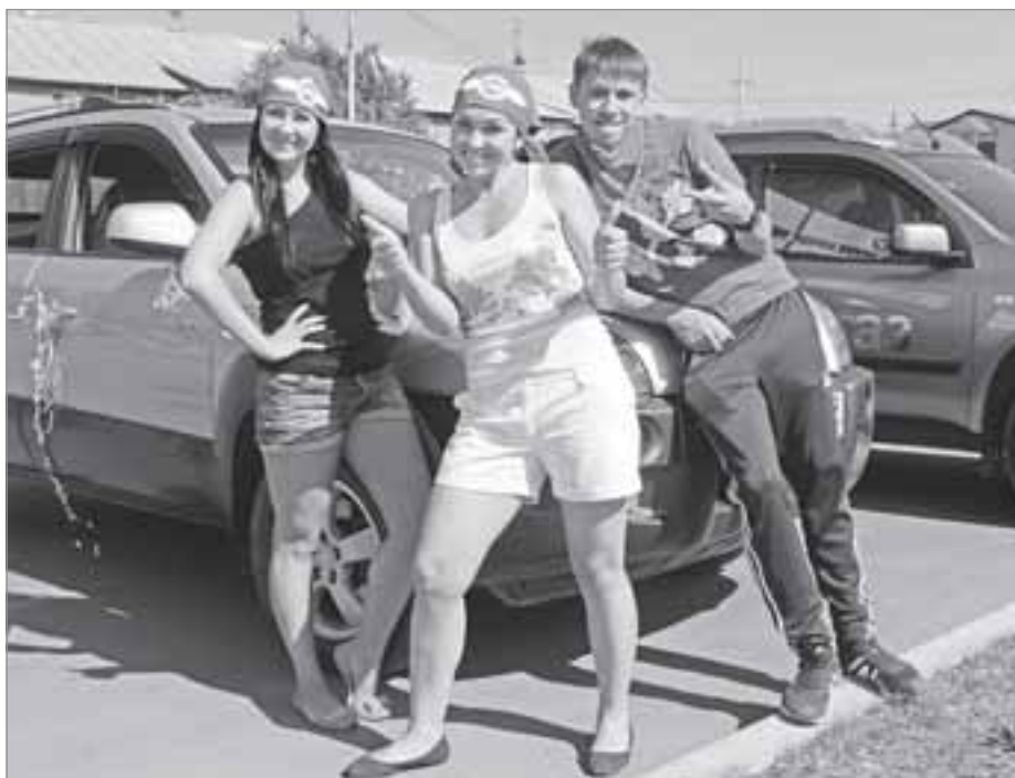
Районная игра подарила участникам заряд бодрости и позитива. На фото команда наших коллег из телерадиокomпании «Луч».

В целом мероприятие прошло, как говорится «на ура» - позитивно и весело, в едином стремлении к победе участники показали настоящую командную игру, в которой один - за всех, и все - за одного! ■