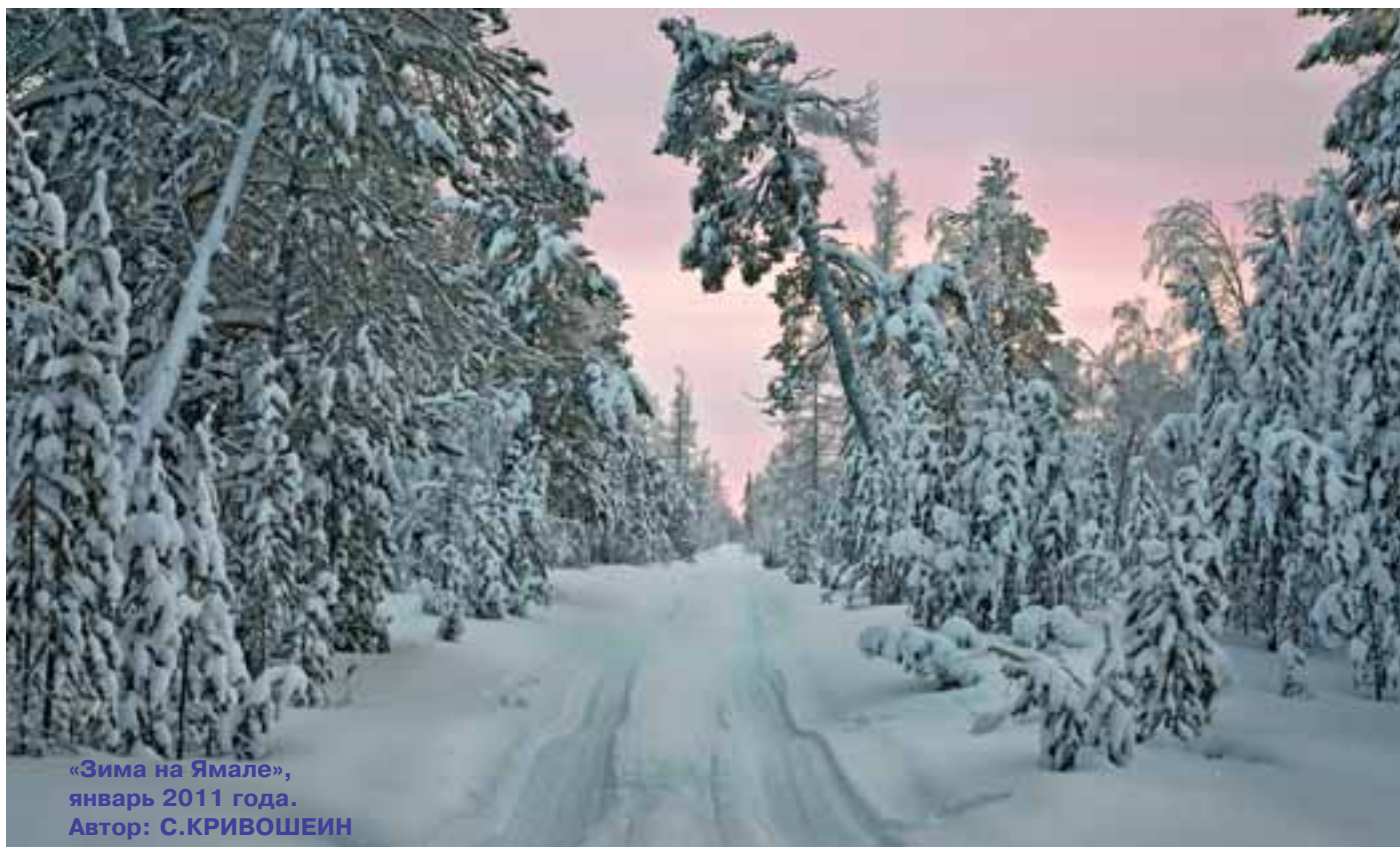
«Зима на Ямале», январь 2011 года.