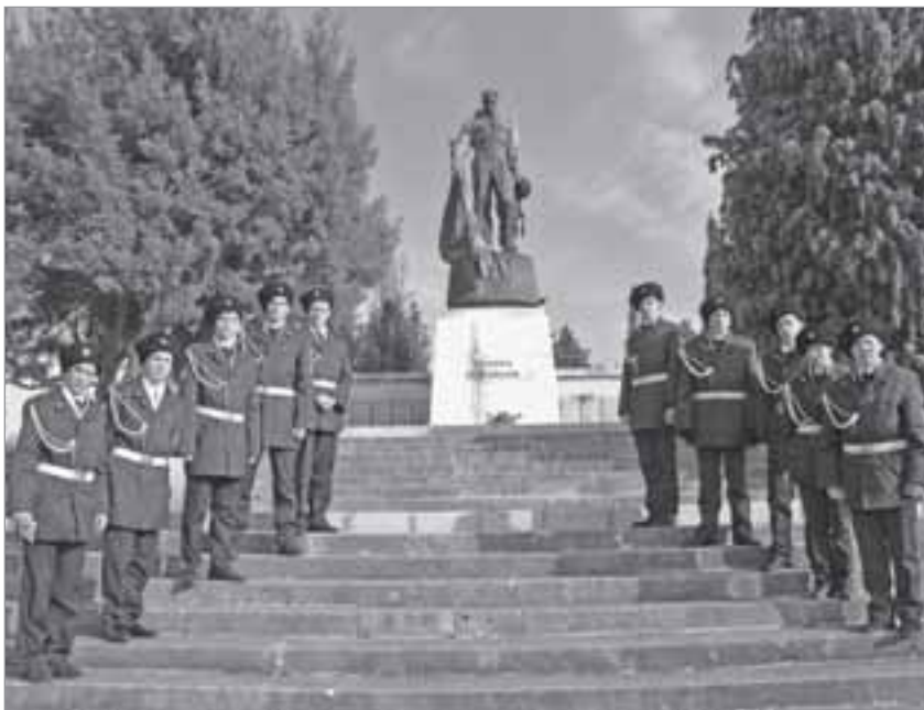
Кадеты побывали на местах боевой славы