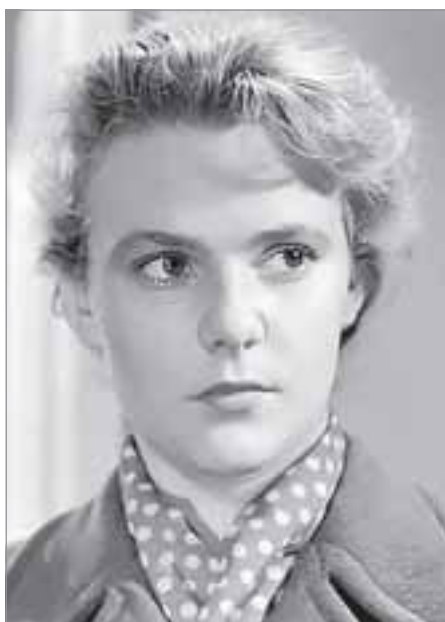
Татьяна из фильма «Весна на Заречной улице»

на? Как неблагородно! Назвать героиню таким именем - это, со стороны поэта, действительно вызов читающей публике. Как? Именем деревенской девки назвать нежную и тонкую дворяночку? До Пушкина Татьян в нашей литературе действительно не было. Впрочем, почти как и в жизни высшего света.