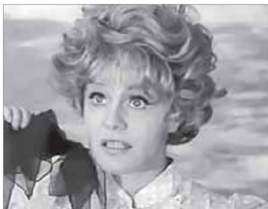
Татьяна из телеспектакля по пьесе Алексея Арбузова «Таня»

Конечно, имя накладывает на человека свой отпечаток, во всех вас, Татьяны, есть что-то общее. Но, несмотря на это, помните, что вы сами - единственный и неповторимый человеческий экземпляр, со своими уникальными способностями и талантами. И если ваши знаменитые тезки смогли добиться в жизни чего хотели, сможете и вы! И пусть свойства вашего имени в этом помогут. ■