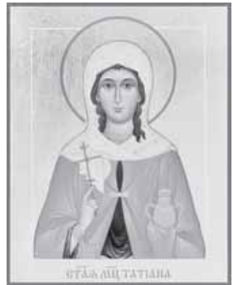
Святая мученица Татьяна

Татьяна упряма, властна, целеустремленна, не терпит возражений, порой депотична. Это очень эмоциональный, артистичный человек с огромным обаянием.