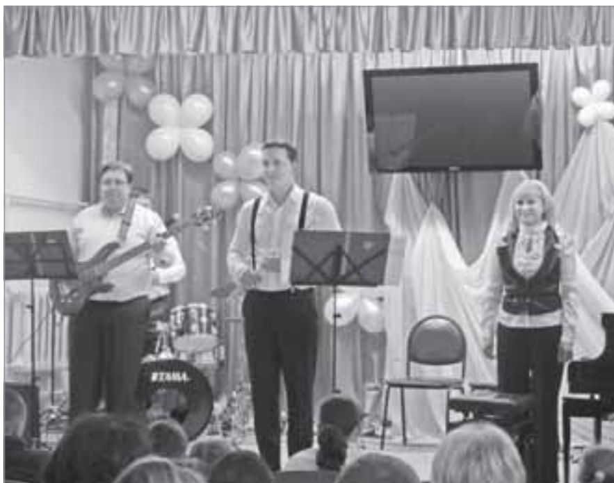
Инструментальный ансамбль «Геммола»

друг другу. Негласный девиз, который лежит в основе воспитания ребят, звучит так: «Главная ценность в жизни - семья». Все преходяще, многого в нашем беспокойном и полном перемен мире можно лишиться в одночасье, но главное, что нужно беречь и чем дорожить, - близкие люди.