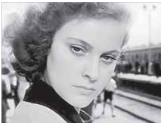
Татьяна из фильма «Разные судьбы»

обладающего каким-то тайным знанием, читающего книгу жизни.