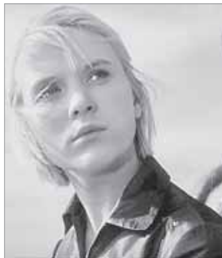
Татьяна из фильма «Дикая собака динго»

И тут вдруг интеллигенция полюбила имя это, и в каждом третьем рассказе из жизни ученых, врачей или адвокатов положительную героиню «с идеями» стали называть Татьяной. Например, в знаменитом рассказе Антона Чехова «Черный монах» так зовут дочь помещика-садовода. Вениамин Каверин в книге «Юность Тани» прослеживает жизнь сначала маленькой девочки, потом молодой девушки, которая после окончания медицинского института становится ученым. Когда-то и пьеса Алексея Арбузова «Таня» была исключительно популярна. Она шла в театрах по всей стране, по ней сняли телеспектакль. Главная героиня - маленькая женщина, умеющая будни превратить в праздник, которая может с легкостью отказаться от себя ради любимого, бро-