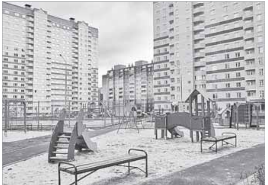
Микрорайон Ямальский-2 ждет своих Ямальских жильцов