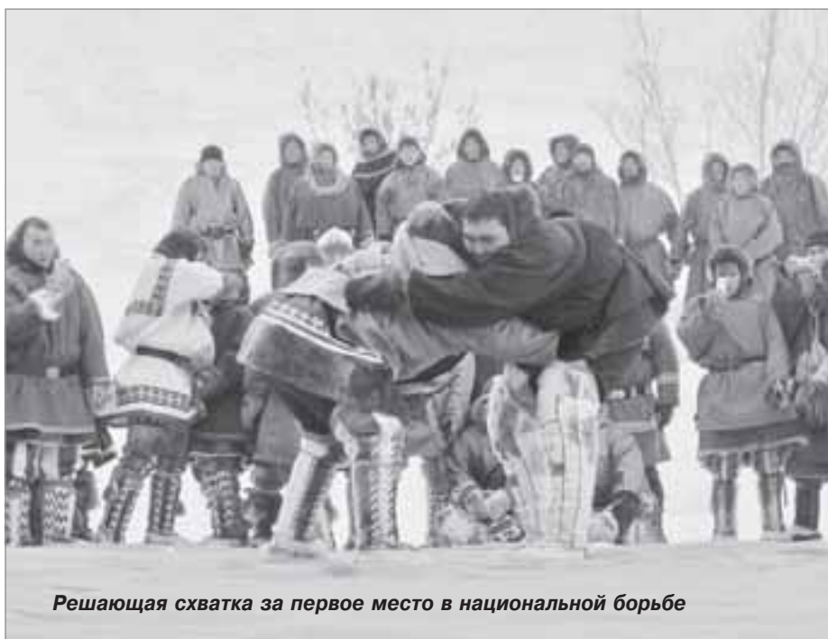
Решающая схватка за первое место в национальной борьбе

Участники соревнований: совхозы «Пуровский» (с. Самбург) и «Верхне-Пуровский» (г. Тарко-Сале), общины «Еты-Яля» (с. Халясавэй), «Харампуровская» (д. Харампур), «Ича» (ф. Быстринка, с. Толька), «Сугмута-Пякутинская» (г. Муравленко), «Пяко-Пуровская» (п. Ханымей) и ООО «Пур-рыба» (г. Тарко-Сале).