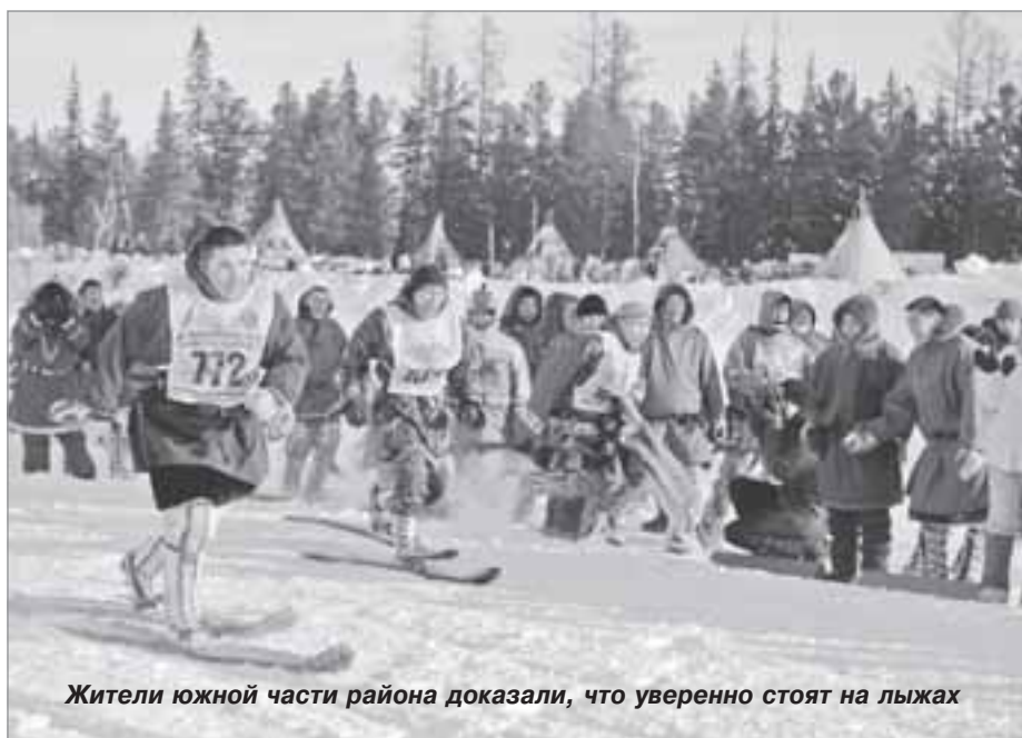
Жители южной части района доказали, что уверенно стоят на лыжах

Важное отличие спортивного праздника в том, что стать участником команды и заявить свою кандидатуру на участие в определенном виде состязаний мог только работающий в агроотрасли на постоянной основе, а не устроенный временно, и стаж его работы на предприятии должен быть не менее года. А вот испытать свое умение управлять упряжкой оленей могли все желающие, вне зависимости от места работы и жительства.