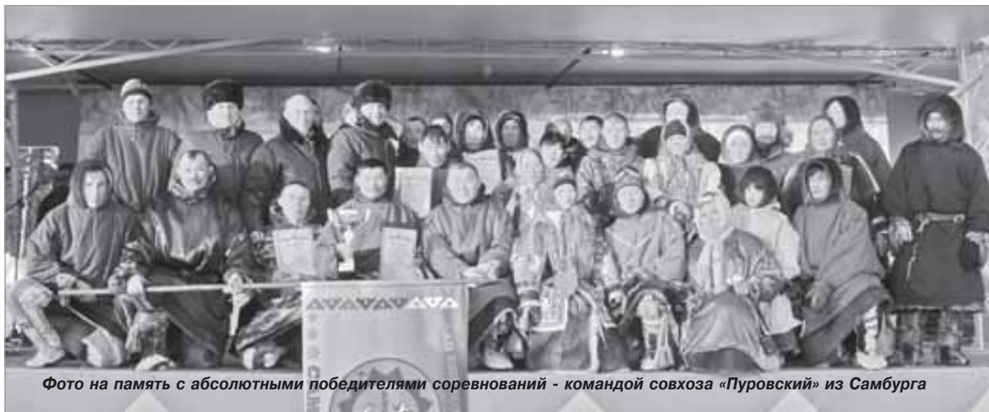
Фото на память с абсолютными победителями соревнований - командой совхоза «Пуровский» из Самбурга

Здорово, что идея главы района собрать в одном месте команды из работников сельхозпредприятий и выявить среди них самую спортивную, реализована стопроцентно. И замечательно, что она работает и будет работать гораздо шире. За короткий срок соревнования между представителями аграрной отрасли вышли за формат чисто спортивных: сейчас они способствуют укреплению межчеловеческих отношений, налаживанию добрососедских связей и даже соединению молодых, которые впоследствии создают семьи и живут в тундре по вековым традициям своих предков.