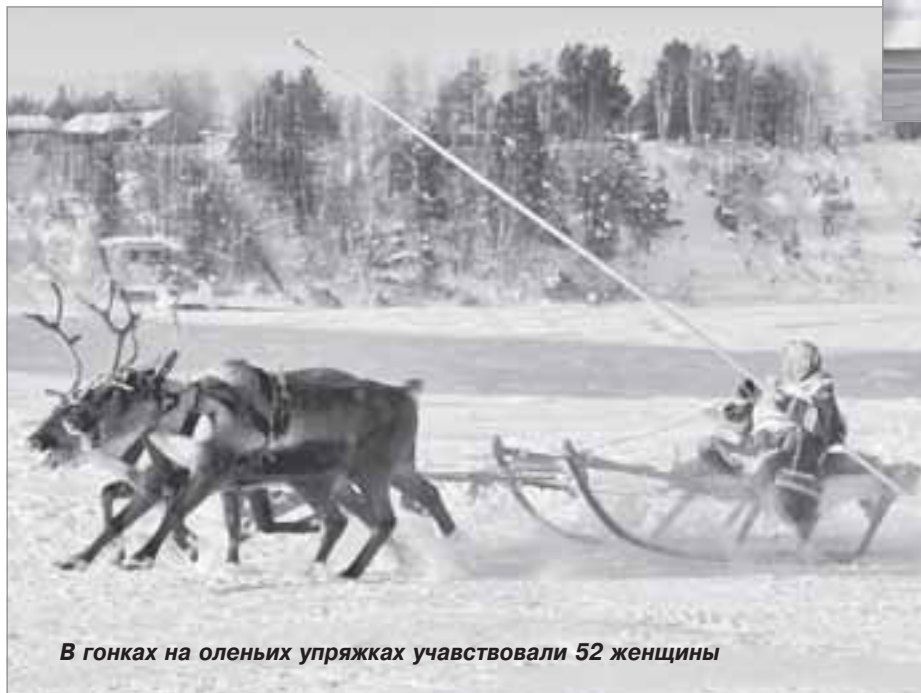
В гонках на оленьих упряжках участвовали 52 женщины

Здорово, что идея главы района собрать в одном месте команды из работников сельхозпредприятий и выявить среди них самую спортивную, реализована стопроцентно. И замечательно, что она работает и будет работать гораздо шире. За короткий срок соревнования между представителями аграрной отрасли вышли за формат чисто спортивных: сейчас они способствуют укреплению межчеловеческих отношений, налаживанию добрососедских связей и даже соединению молодых, которые впоследствии создают семьи и живут в тундре по вековым традициям своих предков.