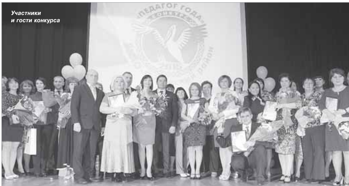
Участники и гости конкурса