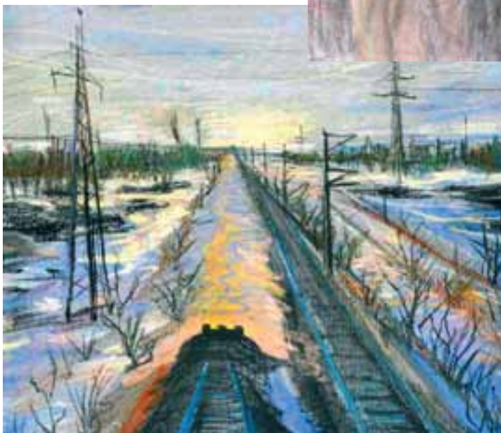
◀ Дорога на Север