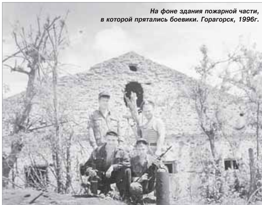
На фоне здания пожарной части, в которой прятались боевики. Горагорск, 1996г.

Попадались ли нам пленные? Куда без них. Интересно было на них посмотреть.