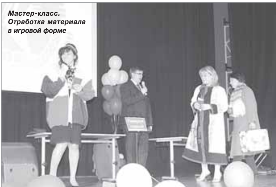
Мастер-класс. Отработка материала в игровой форме

Желаем нашим победителям достойно представить Пуровский район на окружном конкурсе «Учитель года-2015» и вернуться с наградами! ■