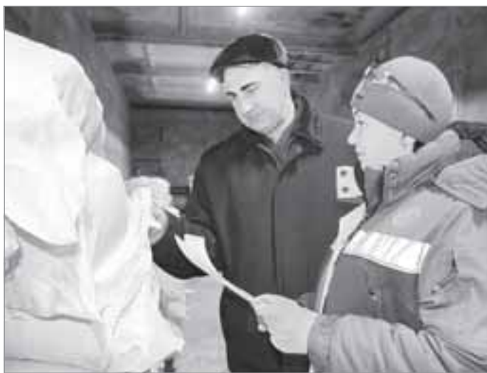
Прием и осмотр грузов - ответственная задача сотрудников производственной базы

водству завода за дисциплину и пунктуальность - все ели строго по графику. Очередей больших не было». С тех пор уже одиннадцатый год ПКOPT-ПНГГ обеспечивает питанием работников Пуровского ЗПК и обслуживает ВЖК в п.Пуровске.