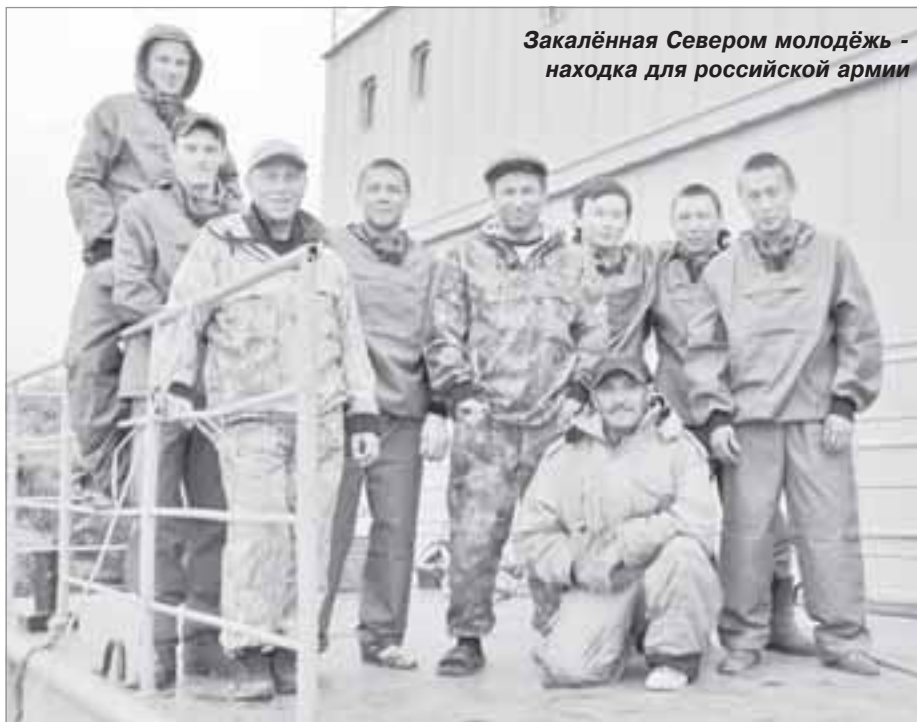
Закалённая Севером молодёжь - находка для российской армии

И теперь примером для молодого поколения служим мы - те, кто не побоялся идти в армию в непростые 90-е годы, когда, как тогда говорили, призывали только тех, у кого или ума нет, или денег. Быть может, и благодаря нам сегодня эта ситуация изменилась. Сейчас наши ребята идут в армию охотно. Меня, как главу села, это очень радует. Самбуржские парни проявляют себя с самой лучшей стороны везде, будь то десантные войска или морфлот. Я могу гордиться и ими, и всем молодым поколением, к которому пришло осознание, что, невзирая ни на изменчивые времена, ни на политическую обстановку, ни на экономические и вообще ни на какие трудности, Родина у нас одна и защищать ее надо. ■