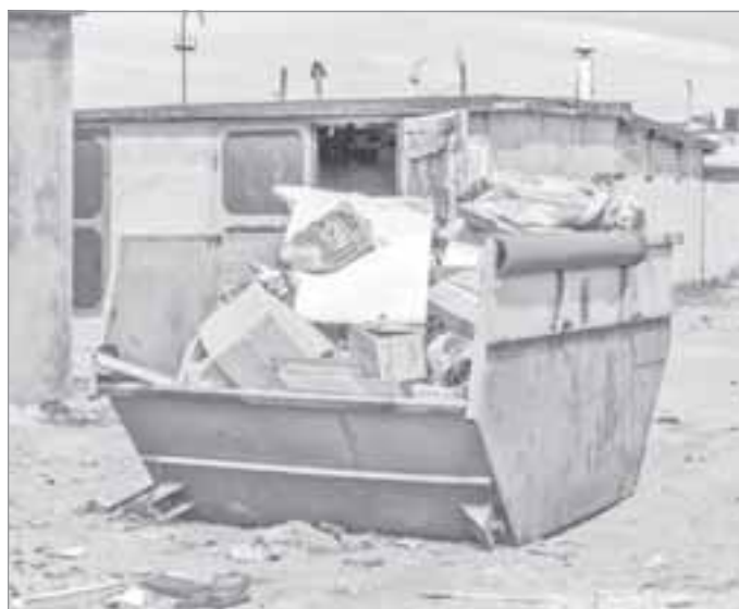
Бункер для крупногабаритного мусора