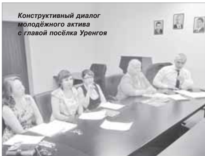
Конструктивный диалог молодежного актива с главой посёлка Уренгоя