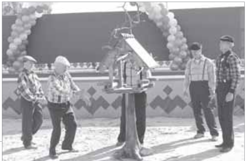
Чудо-кормушка дедуль из Пуровска

В творческом конкурсе участники представили свои номера художественной самодеятельности,