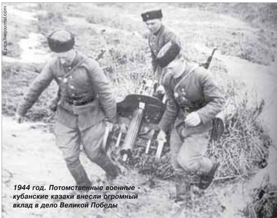
1944 год. Потомственные военные - кубанские казаки внесли огромный вклад в дело Великой Победы

О, это были воистину великие пожары! Их огонь пожирал тысячи жизней, сотни деревень, десятки городов, горел прямо у ног властителей России. Что же в них великого, спросите вы, лишь мрак и ужас, лишь смерть и горе. Но на мой взгляд, именно эти восстания усмиряли аппетиты порой не в меру «голодных» власть предержащих. И кто знает, быть может без всего этого русские революции произошли бы не в XX веке, а намного раньше?