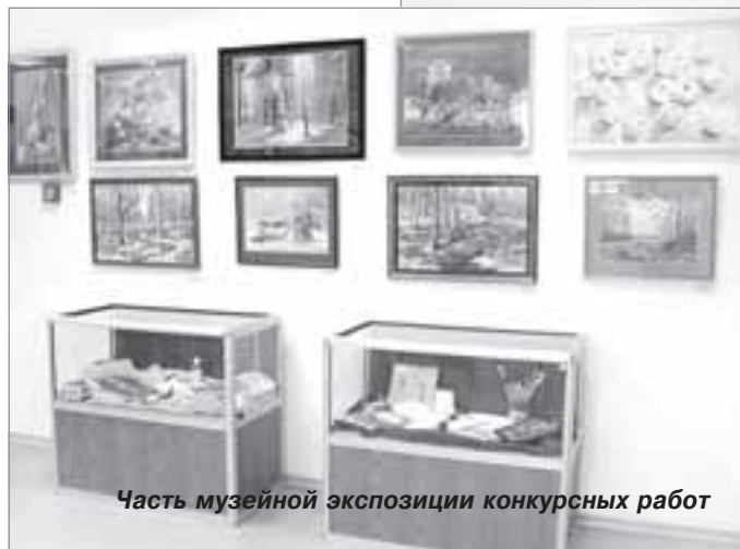
Часть музейной экспозиции конкурсных работ

благодарственными письмами Ханты-Мансийского окружного отделения ВОО «Союз художников России». Работы победителей конкурса выставлены в районном историко-краеведческом музее.