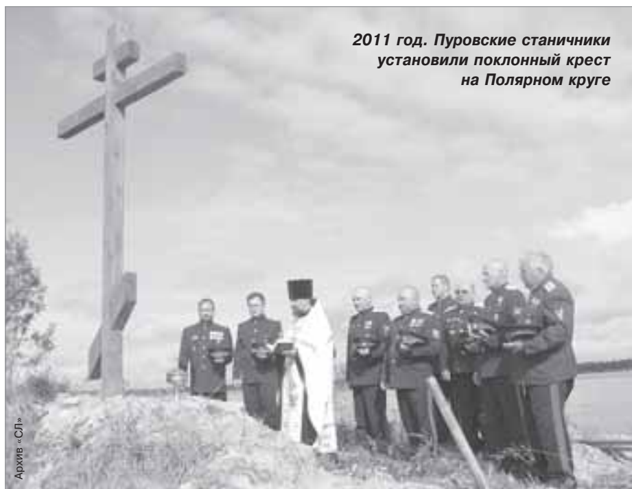
2011 год. Пуровские станичники установили поклонный крест на Полярном круге

В жизни казаков началась новая эпоха. Не исключено, что былого величия им уже не достигнуть, хотя кто знает... И может быть, это и хорошо, ведь почти все их великие свершения так или иначе связаны с войной. А может, в том, чтобы каждый день совершать не столь значимые, но небольшие полезные для людей дела, и есть истинное величие? Что в сегодняшней жизни важнее для страны, для каждого из нас? ■