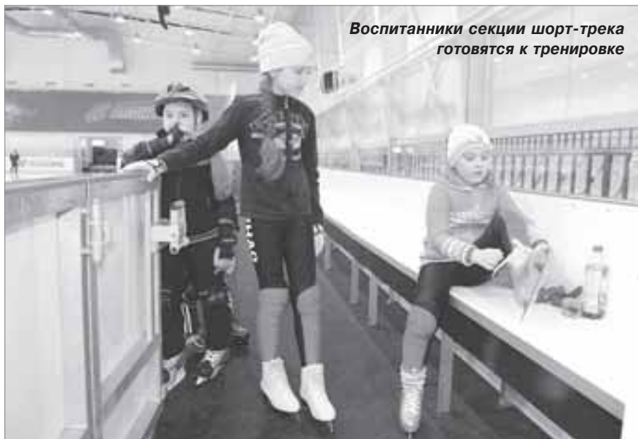
Воспитанники секции шорт-трека готовятся к тренировке

Специальные требования: справка медицинского учреждения о состоянии здоровья ребенка и допуске к занятиям спортом.