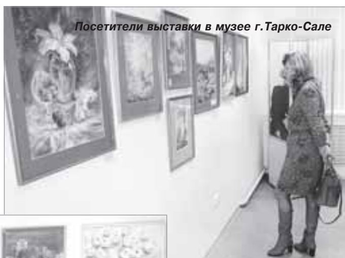
Посетители выставки в музее г.Тарко-Сале