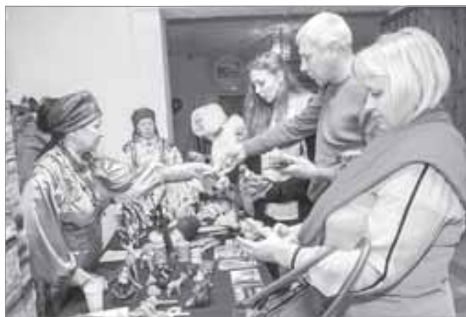
Выставка декоративно-прикладного творчества