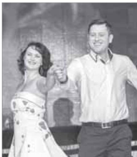
Семейная пара в танцевальном вихре

Эти заметки начинались с толстовского «Все счастливые семьи похожи друг на друга...» В наше, как теперь принято говорить, неспокойное время именно на подобных мероприятиях (да простят читатели корреспондента за это казенное слово) можно совершенно бесплатно заряжаться позитивной энергией, забывая о скверном настроении, окунаться в это похожее семейное счастье, да и просто любоваться красивыми талантливыми земляками. Это так здорово! ■