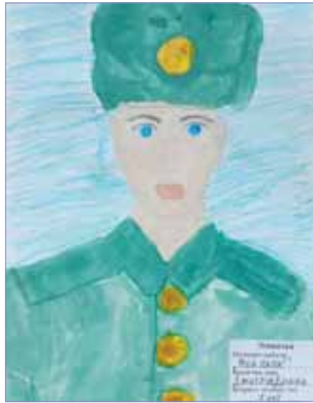
«Мой папа», Диана Дмитрук. 2 место