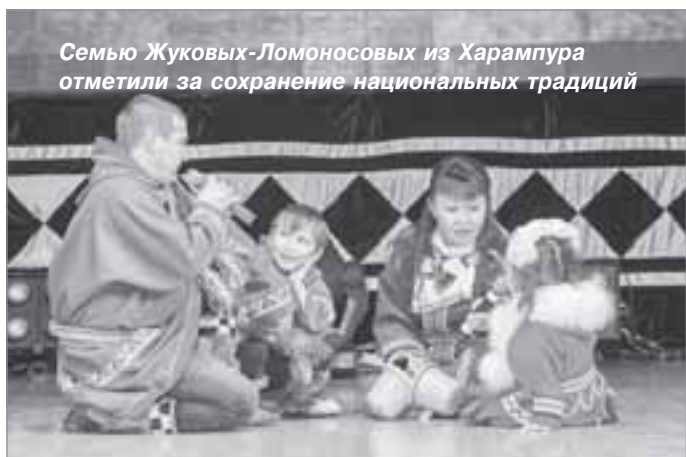
Семью Жуковых-Ломоносовых из Харампура отметили за сохранение национальных традиций