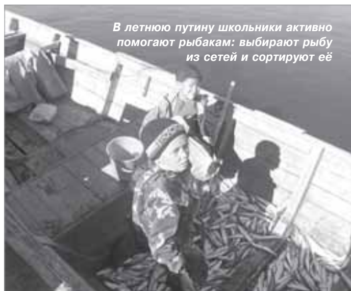
В летнюю пору школьники активно помогают рыбакам: выбирают рыбу из сетей и сортируют её

Я - за трудовое воспитание. Но чтобы оно не было очередным пунктом в плане работы учебного заведения, а являлось полноценной подготовкой к жизни. Сколько выпускников интернатов сегодня сумеют сварить обед, постирать одежду? Сколько из них знает, куда платить за квартиру, где и какое заявление надо написать? Единицы! Страшно, что соблюдение бестолковых, бездумно принятых правил не приносит никакого вреда, даже морального, прокурору или чиновнику от образования, зато в буквальном смысле слова калечит самих юношей и девушек, делает выпускников интернатов ущербными.