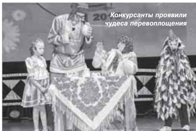
Конкурсанты проявили чудеса перевоплощения