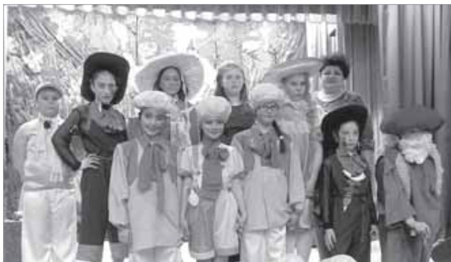
Юные артисты спектакля «Приключения Сыроежки» со своим руководителем, театральный фестиваль «Пуровский раёк», 2015г.

В нем занимаются дети от семи до семнадцати лет, ежегодно свыше шестидесяти человек, а также взрослые - педагоги и родители учащихся. Основа работы театрального объединения - сценическое воплощение литературных произведений.