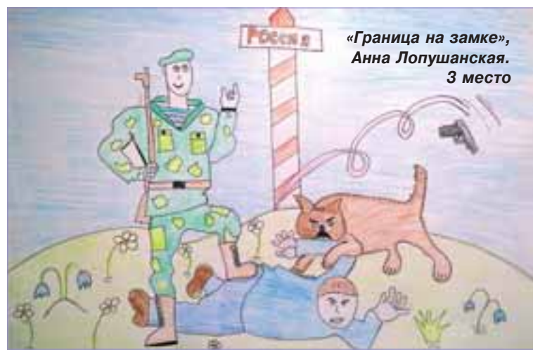
«Граница на замке», Анна Лопушанская. 3 место