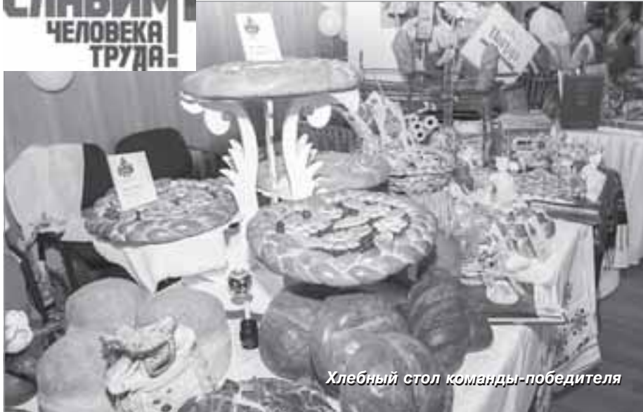
Хлебный стол команды-победителя

АРОМАТ СВЕЖЕЙ ВЫПЕЧКИ И НЕ СРАВНИМЫЙ НИ С ЧЕМ ЗАПАХ СВЕЖЕГО ХЛЕБА ЗАСТАВИЛ ТАРКОСАЛИНЦЕВ, ПОБЫВАВШИХ В МИНУВШИЕ ВЫХОДНЫЕ В ДК «ЮБИЛЕЙНЫЙ» ЗАБЫТЬ О ВСЕВОЗМОЖНЫХ ДИЕТАХ. В ТАРКО-САЛЕ В РАМКАХ СОЦИАЛЬНОГО ПРОЕКТА «СЛАВИМ ЧЕЛОВЕКА ТРУДА!» ПРОШЕЛ КОНКУРС «ЛУЧШАЯ ПЕКАРНЯ РАЙОНА».