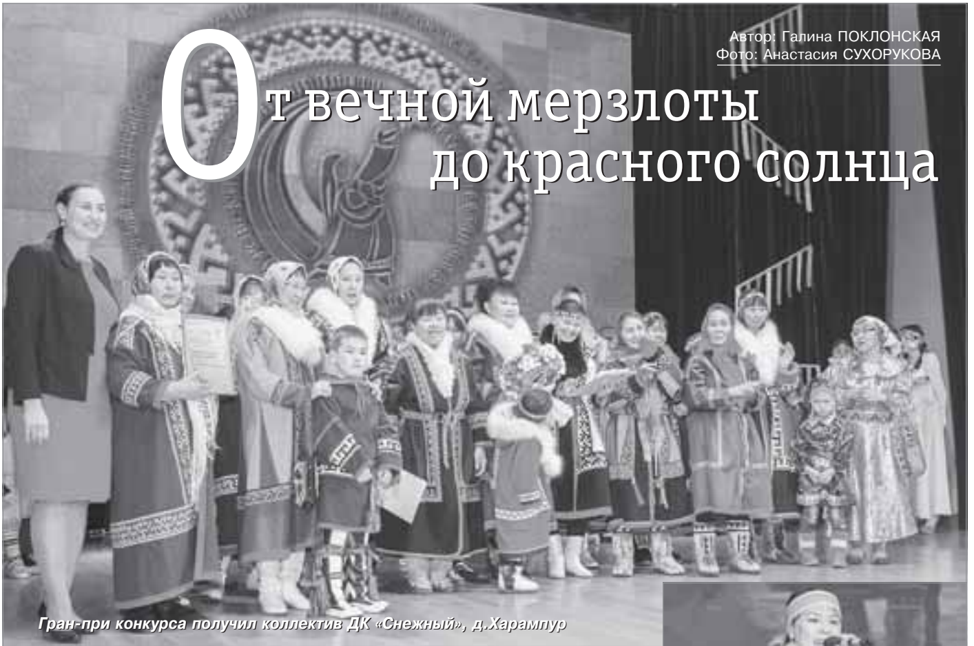
Гран-при конкурса получил коллектив ДК «Снежный», д.Харампур

В РДК «ГЕОЛОГ» С УСПЕХОМ ПРОШЕЛ ОДИННАДЦАТЫЙ ОТКРЫТЫЙ ФЕСТИВАЛЬ-КОНКУРС ТВОРЧЕСТВА КОРЕННЫХ НАРОДОВ СЕВЕРА «СЕМЬ ЦВЕТОВ РАДУГИ». КРОМЕ КОЛЛЕКТИВОВ ПУРОВСКОГО РАЙОНА В НЕМ УЧАСТВОВАЛИ ПРЕДСТАВИТЕЛИ ИЗ МУРАВЛЕНКО И КРАСНОСЕЛЬКУПА.