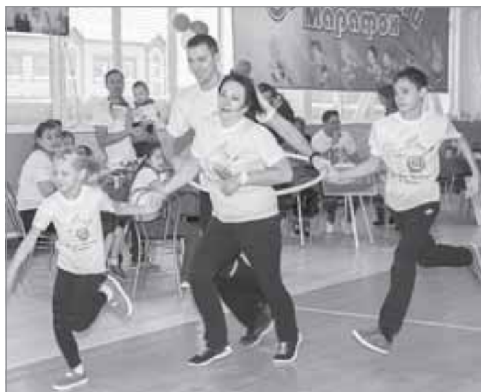
Первый день конкурса: семейная эстафета

Затем началась конкурсная программа. Команды представляли свои визитные карточки с гербами и девизами,