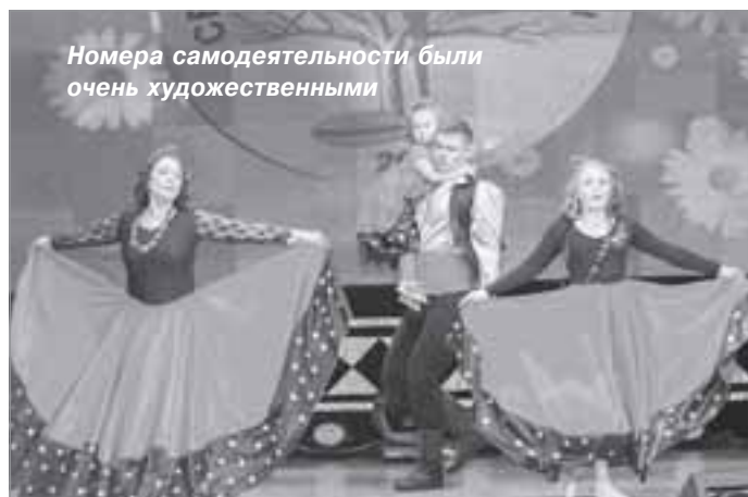
Номера самодеятельности были очень художественными