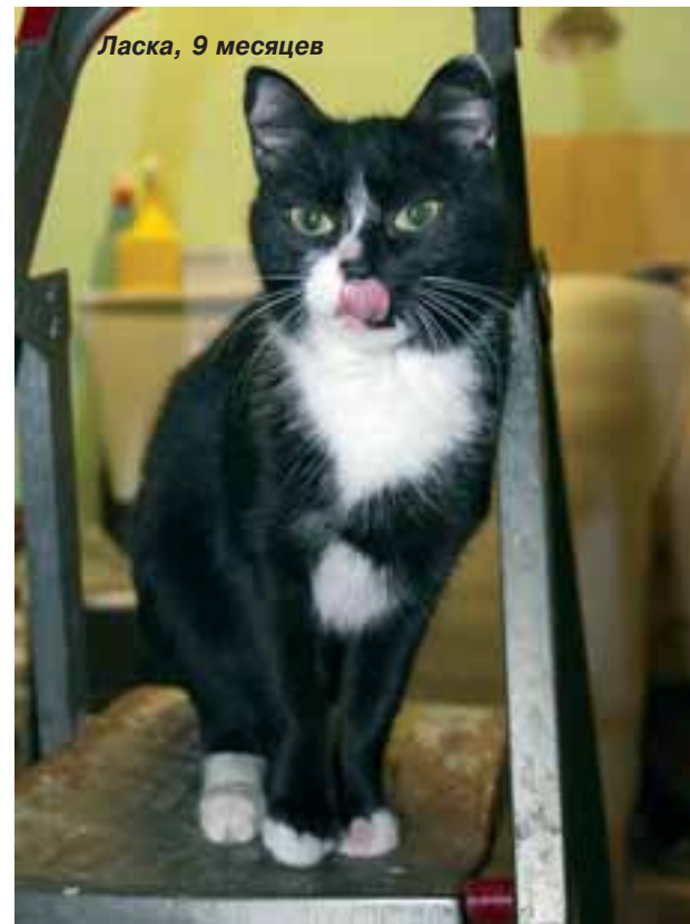
Ласка, 9 месяцев

Если вы решили стать котейкиным «родителем», то в любое время можете позвонить по телефону: 8 (922) 0910018 и забрать пушистое чудо в свой дом. ■