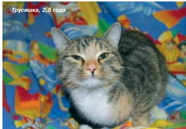
Трусишка, 2,5 года