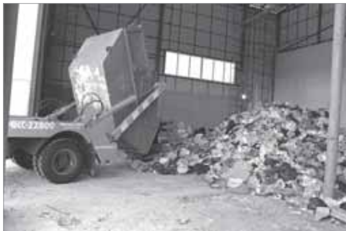
Ежедневно с улиц Тарко-Сале, Пуровска и Сывдармы вывозится около 15 машин мусора

Кстати, топливо для котельной планируется производить самостоятельно. Уже приобретено оборудование, позволяющее из отходов древесины изготавливать pellets, которые будут использоваться для собственных нужд, а в будущем, возможно, и для нужд потребителя.