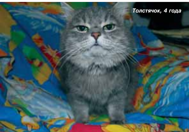
Толстячок, 4 года