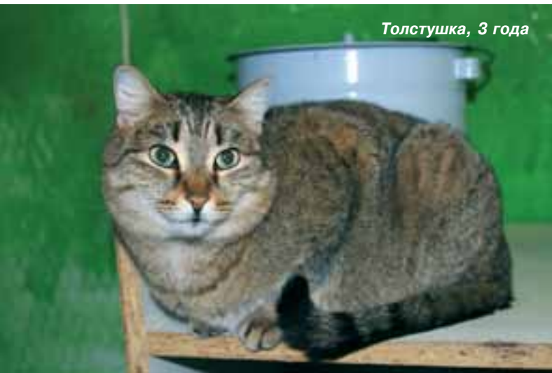
Толстушка, 3 года