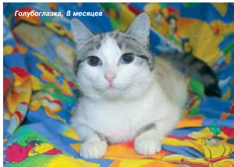
Голубоглазка, 8 месяцев