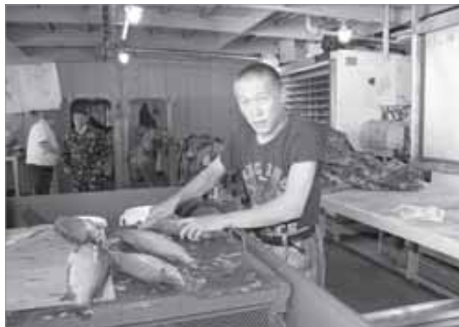
Северный агропром нуждается в молодых кадрах

- Обязательно! Пуровский район - это богатейшая сельскохозяйственная база. Здесь есть практически все