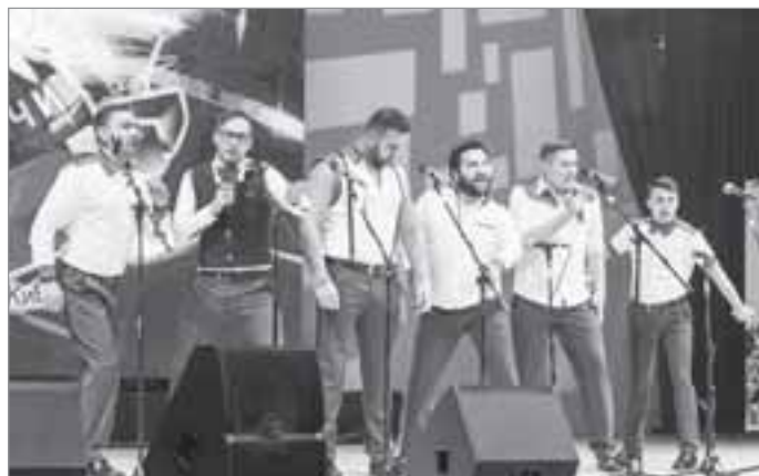
Международный фестиваль КВН «КиВиН-2016», январь, г.Сочи