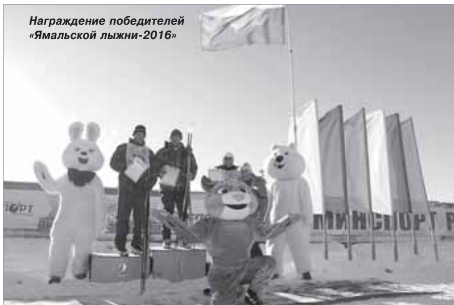
Награждение победителей «Ямальской лыжни-2016»

Любимые многими лыжные состязания 2016 года - «Лыжня России» и «Ямальская лыжня» завершились, эти праздники зимнего вида спорта мы встретим лишь в будущем, 2017 году. А пока есть отличная возможность вдоволь потренироваться, чтобы в следующий раз не просто пробежать нелегкую дистанцию, а подняться на пьедестал почета!