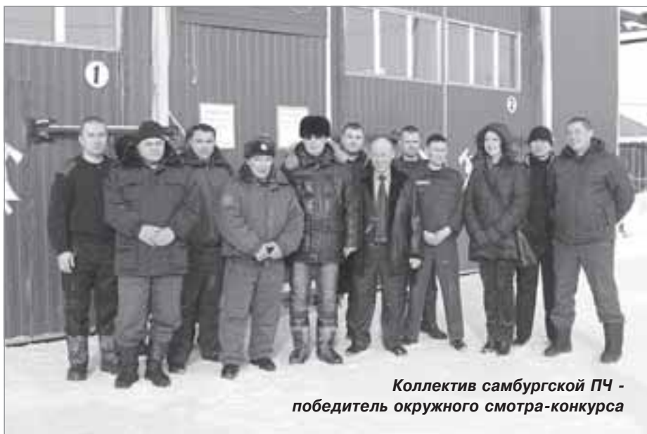
Коллектив самбургской ПЧ - победитель окружного смотра-конкурса

- У основной массы жителей села, которые являются представителями КМНС, нет возможности пользоваться льготами на лекарства и получать их в поликлинике, - рассказал главврач. - Помещение для аптеки есть, необходимо найти индивидуального предпринимателя, поставщика.