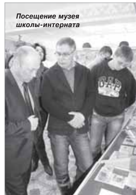
Посещение музея школы-интерната

Кроме проблем с техническим оснащением, работу местных врачей сильно затрудняют вопросы обеспечения муниципалитета лекарственными препаратами, которых нет в свободной продаже из-за отсутствия аптечного пункта на территории села.