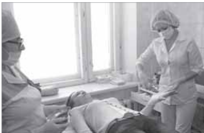
Через добрые руки перевязочной сестры прошло огромное число земляков