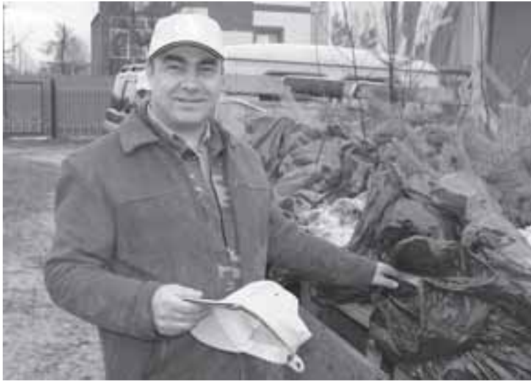
Автор: Мария ШРЕЙДЕР