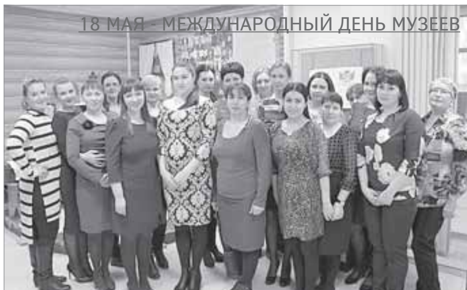
18 МАЯ - МЕЖДУНАРОДНЫЙ ДЕНЬ МУЗЕЕВ

12 сентября 1999 года стало знаменательным событием для сотрудников и всех таркосалинцев - краеведческий музей разместился в новом помещении в капитальном здании по хорошо знакомому всем адресу: улица Республики, д. 17.