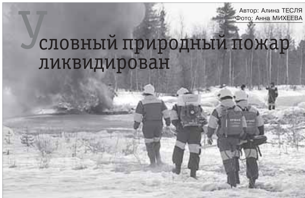
Автор: Алина ТЕСЛЯ

По замыслу учений, природный пожар, представлявший угрозу лесному массиву и дачным участкам в черте г.Тарко-Сале, был успешно локализован и ликвидирован.