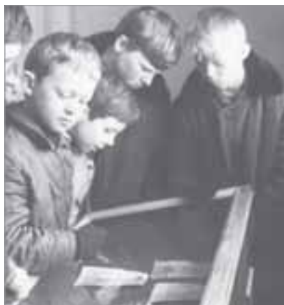
Первые посетители музея. Конец 1972 года

Сегодня музей занимает 605 кв. м. Тридцать сотрудников трех отделов (экспозиционно-выставочного, культурно-образовательной деятельности, а также учета и хранения фондов) вовлечены в музейную работу, важной составляющей которой является научно-исследовательское направление.