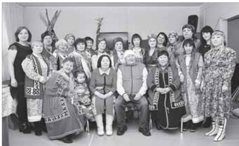
Заседание клуба «Вековые традиции»