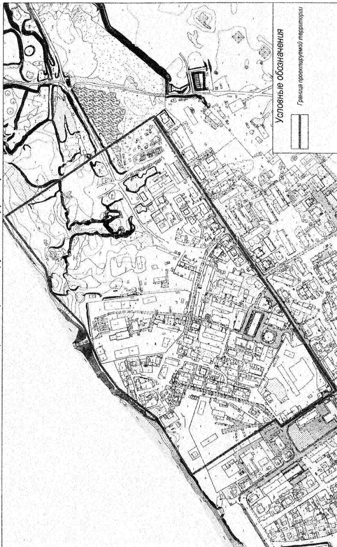
Схема границ проектируемой территории

Приложение к распоряжению Администрации района от " 06 " декабря 2016 г. № 768-РА