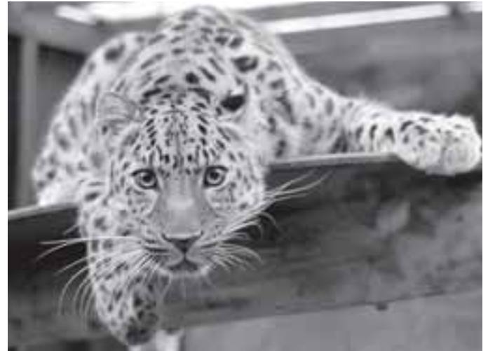
Дальневосточный леопард находится под защитой WWF

Все, кто хочет внести свой вклад в сохранение экологии планеты, могут принять участие в акции