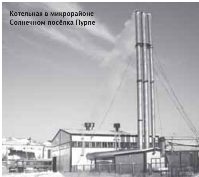
Котельная в микрорайоне Солнечном посёлка Пурпе

Усовершенствованные двухтопливные горелки, позволяющие работать на резервном дизельном топливе, повышают надежность функционирования оборудования, частотные преобразователи, дающие экономии электроэнергии в разы и снижающие вероятность аварийных ситуаций