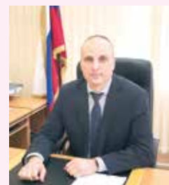
Андрей ПУСТОВОЙ, председатель Пуровского районного суда

«Неявка вызванного судом кандидата может сорвать процесс формирования коллегии присяжных заседателей, что существенно затрудняет процедуру судопроизводства, ведёт к увеличению сроков судебного разбирательства и нарушению прав подсудимого и потерпевшего на соблюдение разумных сроков рассмотрения дела».