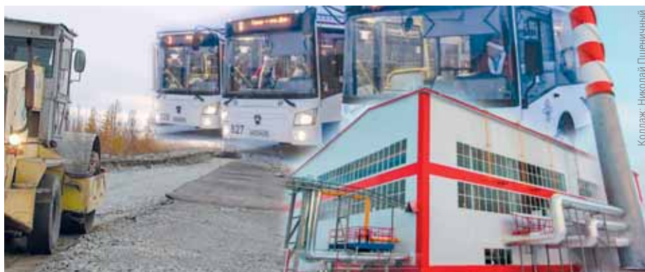
Коллаж: Николай Пшеничный

По материалам пресс-служб губернатора, полпреда в УрФО, vk.com, ИА «Север-Пресс» и собкоров