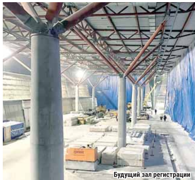
Будущий зал регистрации

полётов. Строители уже закрыли тепловой контур здания, ведут внутренние работы. Общая площадь аварийно-спасательной станции составит около 2100 кв. метров. Она спроектирована по всем требованиям авиационных правил, включает в себя шесть боксов для пожарных машин, смотровую башню высотой более 20 метров и специаль-