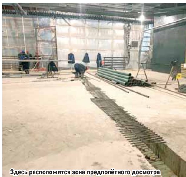
Здесь расположится зона предполётного досмотра

Управляющая компания «Аэропорты Регионов», в чьём ведомстве аэропорт Нового Уренгоя, ведёт масштабную реконструкцию аэропорта в рамках концессионного соглашения, заключённого в марте 2018 года с правительством ЯНАО. Это первый в России проект развития аэропортовой инфраструктуры, реализуемый в рамках закона о концессионных соглашениях. Срок действия соглашения составит 30 лет, из которых 3,5 года займёт инвестиционная фаза.