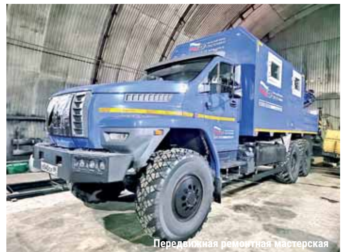
Передвижная ремонтная мастерская

служивал пожарно-охранную сигнализацию. В очередной северной командировке встретил свою будущую супругу,