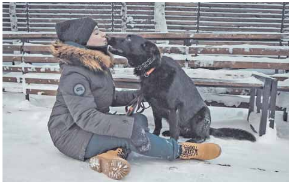
Фото с любимым питомцем могут стать отличным дополнением семейного фотоальбома. В нашей семье снимков с четвероногими очень много, взрослые и дети очень любят такой вид съёмки.

Ими можно приманить к себе собаку, усадить в нужную вам позу, а если ваш пёс ещё и более крутые вещи исполняет, то такое просто не может не попасть в кадр!