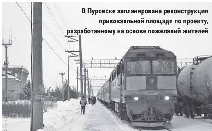
В Пуровске запланирована реконструкция привокзальной площади по проекту, разработанному на основе пожеланий жителей

новке освещения. Проезжую часть на въезде в посёлок, ведущую к железнодорожному вокзалу, заасфальтируют. Места для парковки перене-