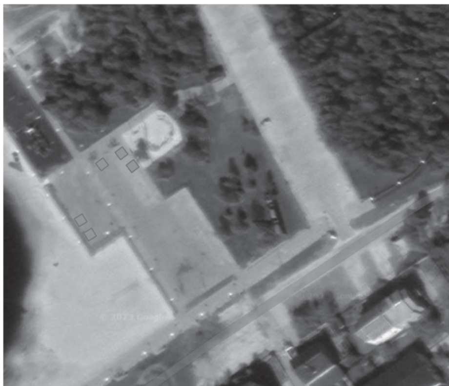
СХЕМА размещения участников ярмарки выходного дня на территории города Тарко-Сале (парк «Прибрежный»)

№№ 1 - 5 - места для размещения участников ярмарки размерами 2 x 3 м., 4 x 3 м. для реализации продовольственных и непродовольственных товаров;