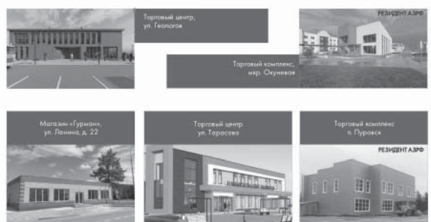
Торговый центр, ул. Гелогова