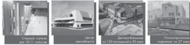
Старшая ступень для 10-11 классов